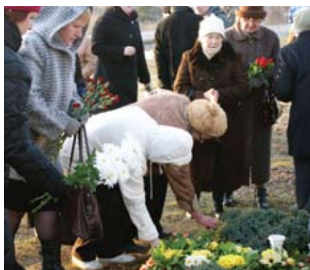
Genocīda piemiņas pasākums ⇨ 4. lpp.

Ķekavas novada pašvaldības izdevums • Baloži, Ķekava, Daugmale • Aprīlis, 2010 • Nr. 05 (128)