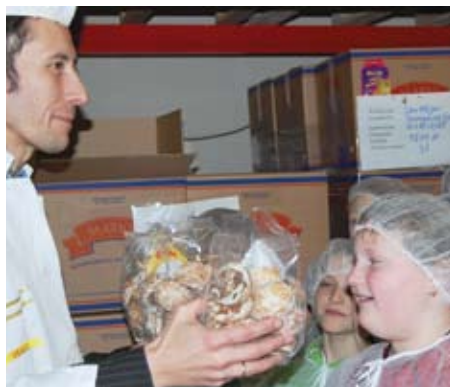
Garšojam saldumus ⇨ 5. lpp.