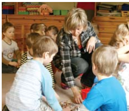
Vecāki bērnudārza solos ⇨ 5. lpp.