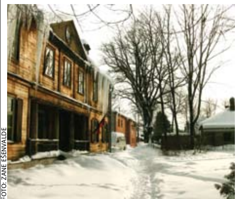
Depkina muiža Rāmavā.