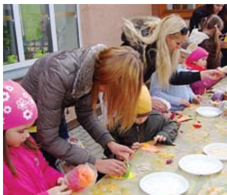
Lieldienas iešūpotas ⇨ 12. lpp.