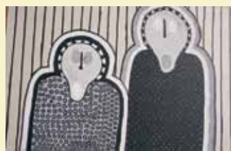
Kristiāna Zepa 15 gadi zelta godalga (Taivāna)