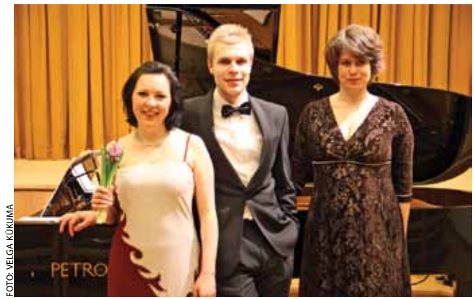
Koncerta Krievu mūzikas skaņas mākslinieki Doles tautas namā.