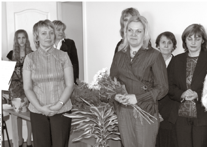
Labā vēlējums turpmākajam darbam saņēma Ķekavas sociālās aprūpes centra un dienas centra Adatiņas vadītāja un darbinieki.

Ķekavas sociālās aprūpes centra paspārnē esošais dienas centrs Adatiņas izveidots ar Eiropas Reģionālās attīstības fonda finansiālu atbalstu, kopumā izmaksājot aptuveni Ls 50 000, Ls 42 000 no tiem finansēja ERAF, Ls 7000 – Ķekavas novada pašvaldība un Ls 734 – valsts budžeta dotācija. Projekta ietvaros tika iegādāts un uzstādīts