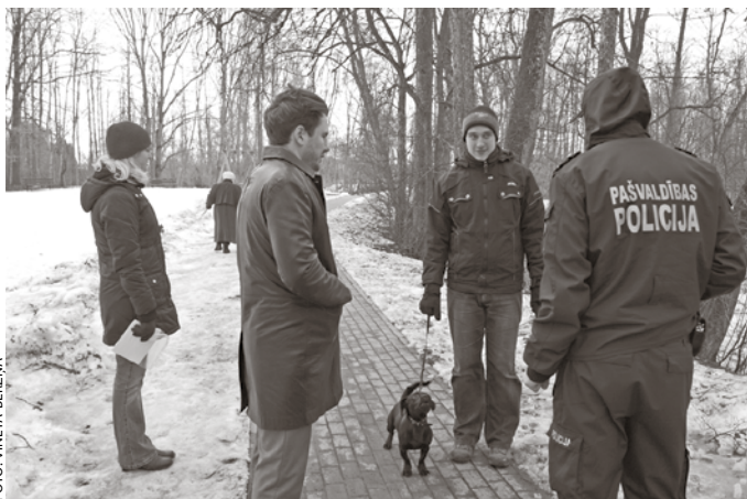
Izglītojoša reidā sastaptie suņu īpašnieki dāvanā saņem speciālus maisiņus suņu atstāto dārgumu savākšanai.

Atgādinām, ka atbilstoši Latvijas Administratīvo pārkāpumu kodeksam sods par dzīvnieku turēšanas, labturības, izmantošanas un pārvadāšanas prasību pārkāpšanu – brīdinājums vai naudas sods fiziskajām personām