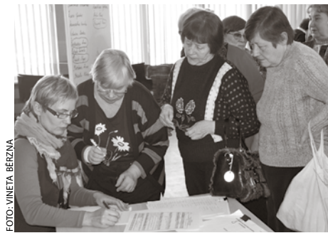
Pensionāri aktīvi iesaistījās biedrības mērķu un statūtu apspriešanā.

Pēc ilgām diskusijām sanākušie pensionāri vienotās, ka biedru nauda būs divi lati gadā.