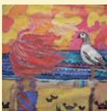
Krista Raudive 12 gadi 3. vieta (Latvija)