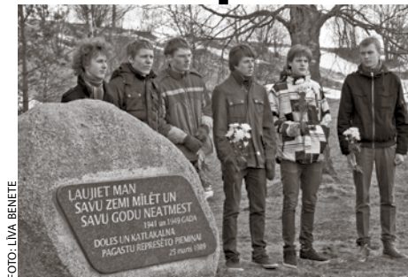
Ķekavas vidusskolas audzēkņi, pieminot komunistiskā genocīda upurus

"Jēzus uznesa mūsu grēkus Savā miesā pie krusta, lai mēs, grēkiem miruši dzīvotu taisnībai, ar Viņa brūcēm jūs esat dziedināti." 1. Pt. 2:24