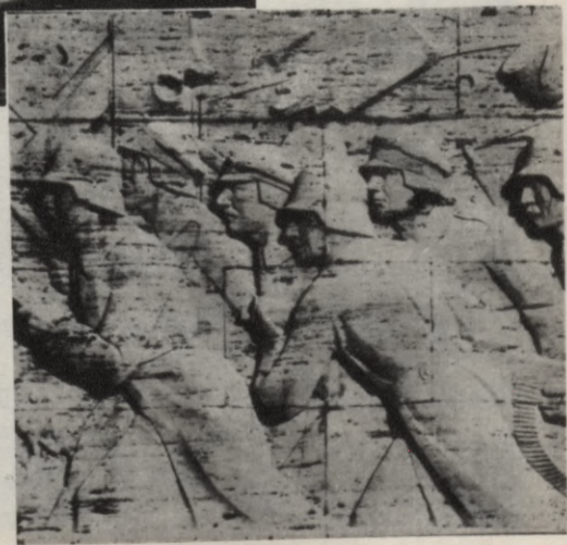
Brīvības pieminekļa cilnis «Cīņas ar bermontiešiem uz Dzelzs tilta 1919. gadā»