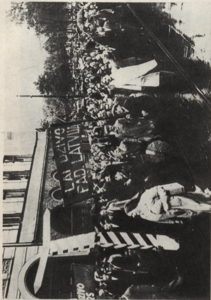
Demonstrācija 1940. gada jūlijā Rīgā