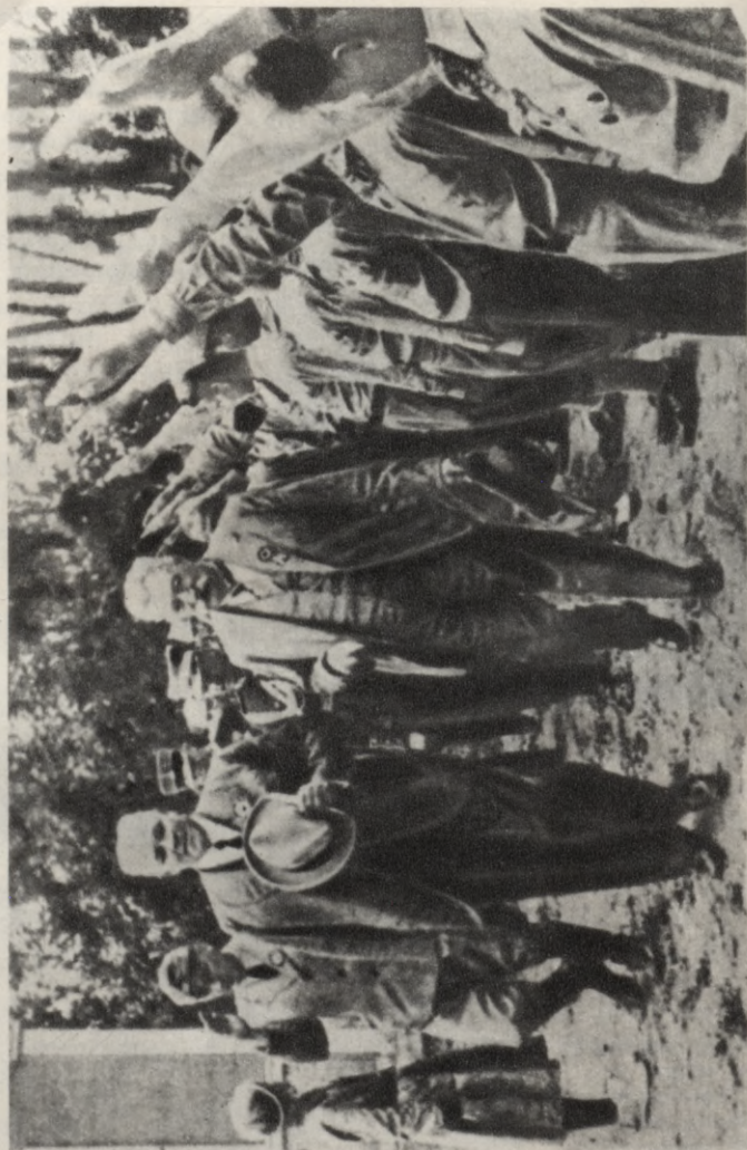
Mazpulki sveic Kārli Ulmani Jaunatnes svētkos 1937. gadā.