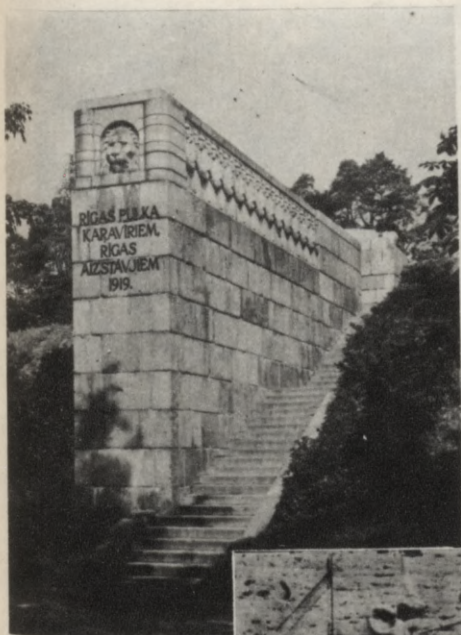
Sudrabkalniņš. Piemineklis 6. Rīgas kājnieku pulka karavīriem, kas krituši cīņās pret bermontiešiem (tēln. K. Zāle, arhīt. E. Štālbergs). Atrodas Imantā starp Slokas ielu un Komarova prospektu