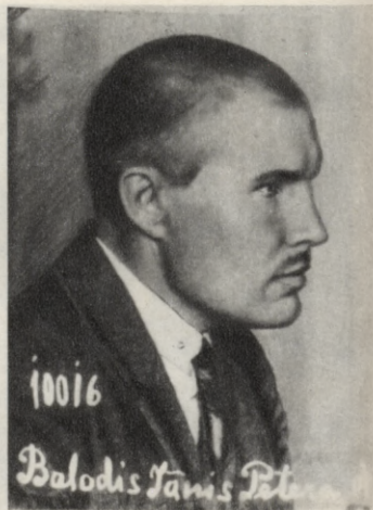
Jānis Balodis — saeimas Strādnieku un zemnieku frakcijas priekšsēdētājs (1930.—1931.)