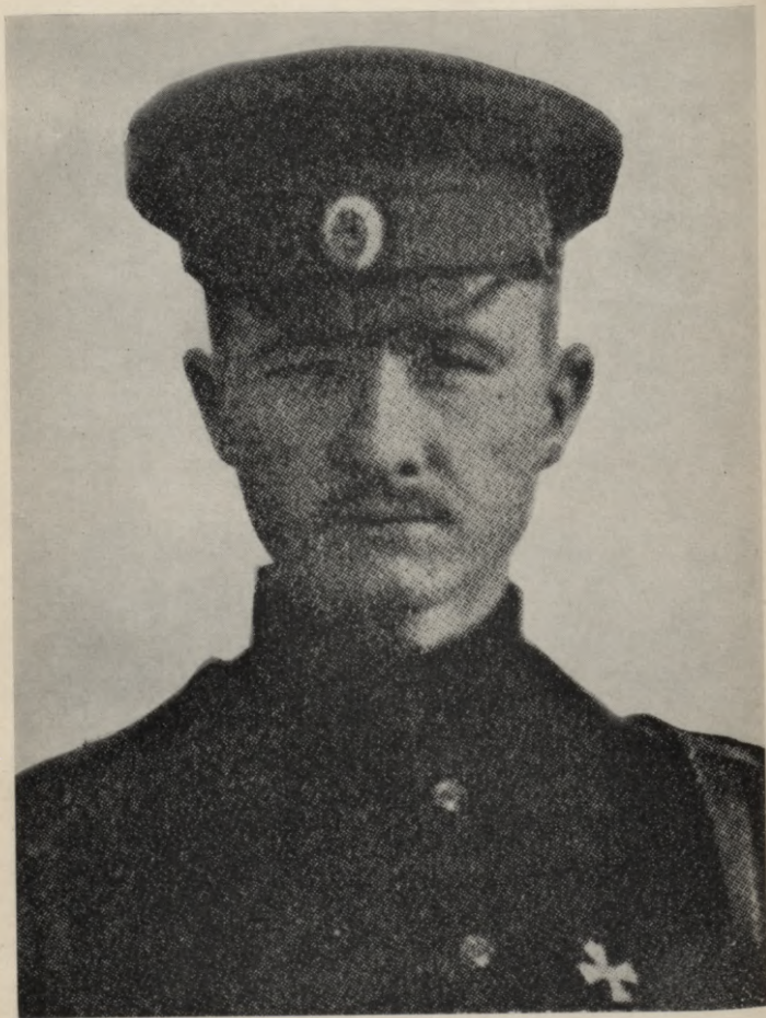
Ģīmetne, kas ievietota izdevumā „Zvaigžņu pulku atmirdza”.