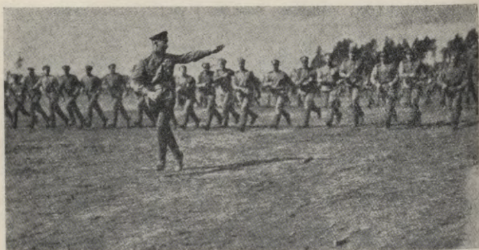
Kukuļmuižniekos 1916. g. septembrī, apmācot skriešanā.