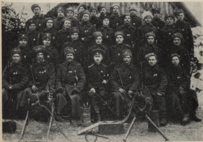
Savas rotas Jura krusta kavalieru vidū.