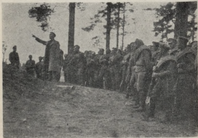
Briedis paskaidro taktisku uzdevumu.