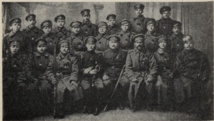
Pirmie Jura krusta kavalieri ar Bangerski un Briedi.