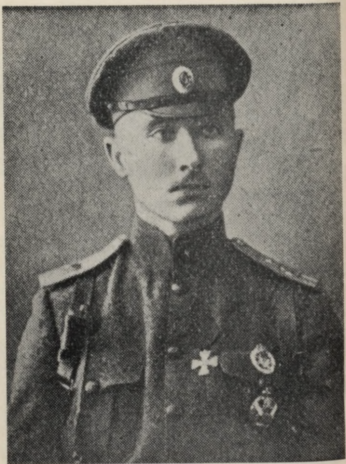
Brieža ģīmetne Latv. Konvers. Vārdnīcā.