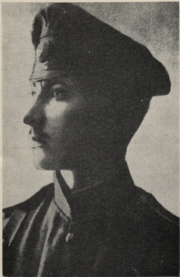
Virslieitnants, 1. Daugavgrīvas latviešu strēlnieku bataljona 1. rotas komandiers.