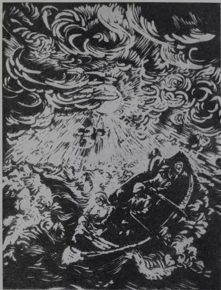
MARIJA INDUSE-MUCENIECE Bēgļu laiva