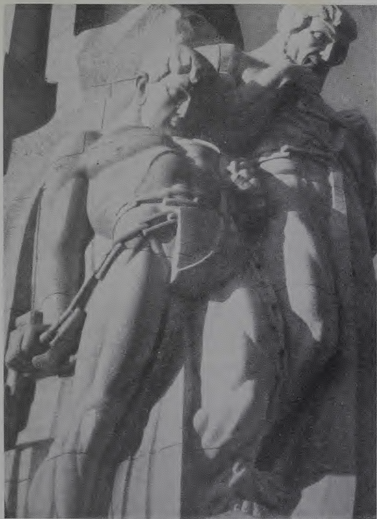
KĀRLIS ZĀLE Važu rāvēji

"Kedjesprāngarna". Detalj frān lettiska frihetsmonumentet i Riga