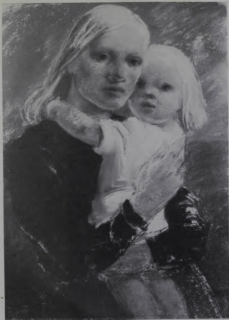
EDUARDS DZENIS Dieva putniņi