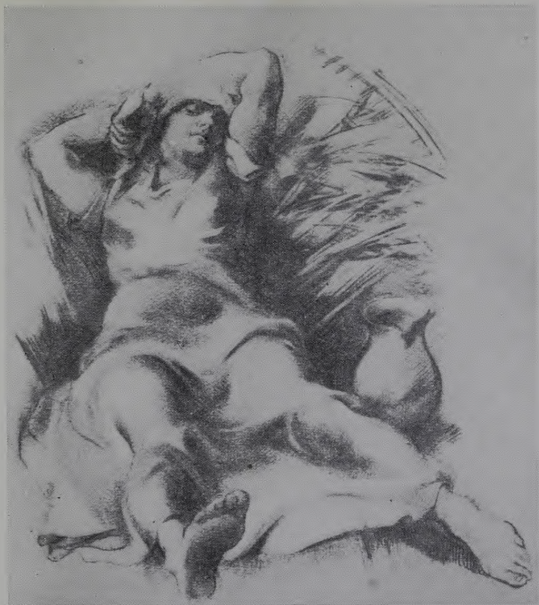
OSKARS NORITIS Bija vasara