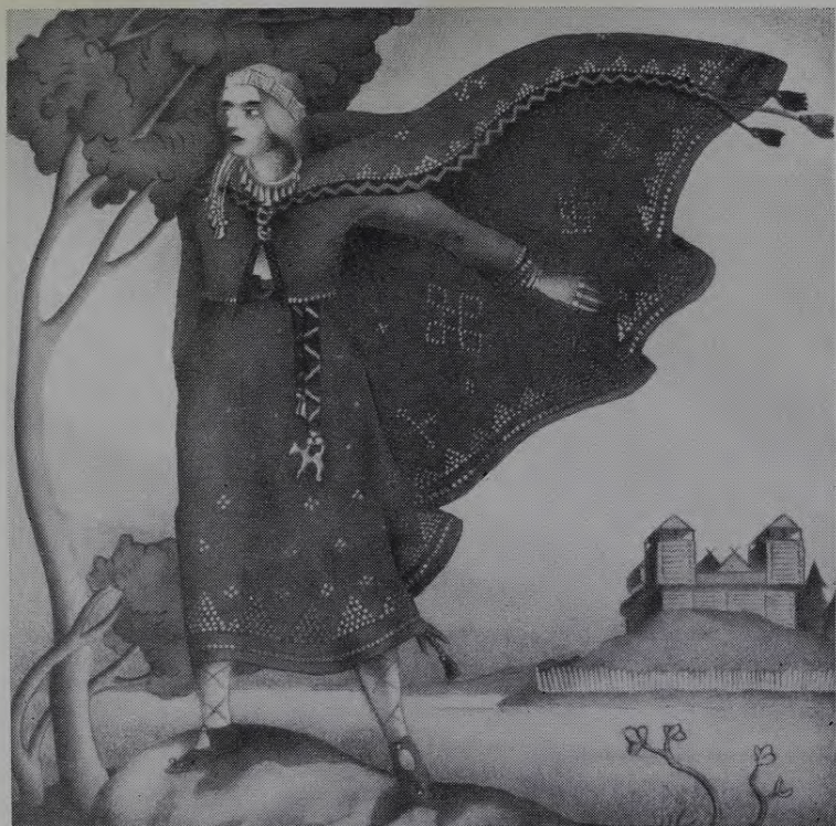
NIKLĀVS STRUNKE Senlatviete