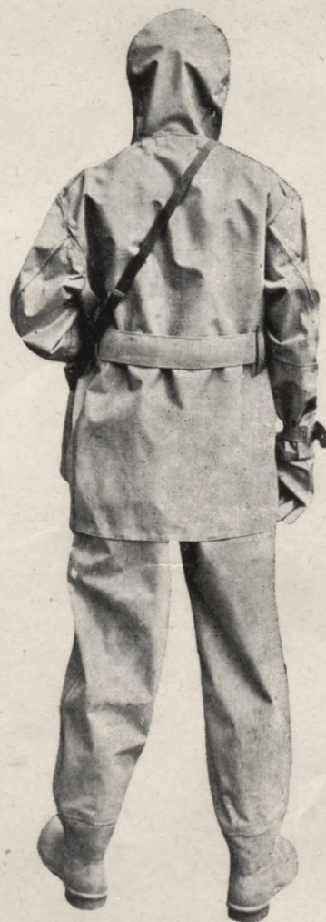
3. Divdaļīgs pretgāzu uzvalks no mugurpuses.