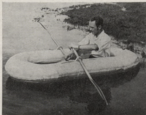
7. Sporta laiva ar irkļiem.

Laivu parocīgai iesaiņošanai un transportam izgatavo specialu aizsarg-apsegu no ūdensdroša gumijota auduma.