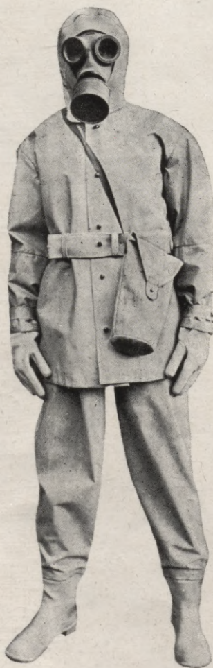
2. Divdaļīgs pretgāzu uzvalks.

Visas gāzu masku izgatavošanai vajadzīgās gumijas daļas piegādā atzītā augstvērtīgā kvalitātē. Izsmēlošas ziņas sniedz uz pieprasījumu.