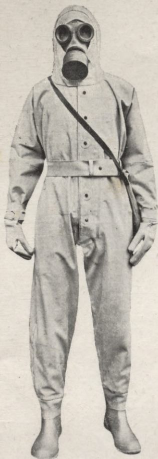
1. Viendalīgs pretgāzu uzvalks.