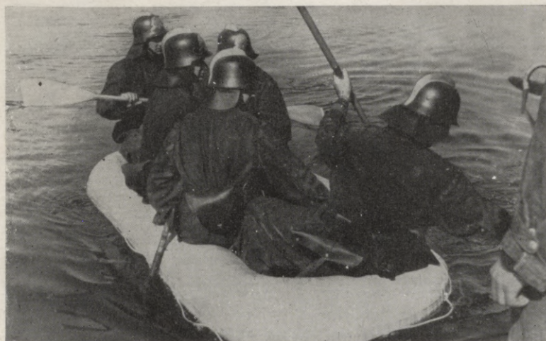
6. Glābšanas laiva ugunsdzēsējiem.