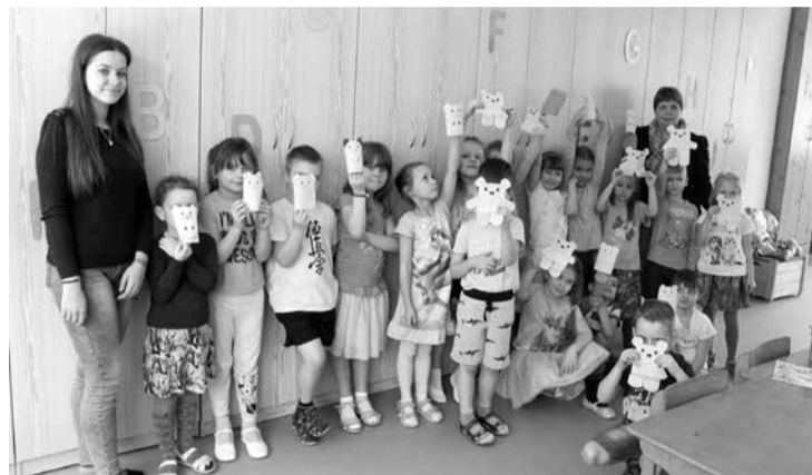
Annai “Ēnu dienā” bija iespēja iejusties audzinātājas lomā.