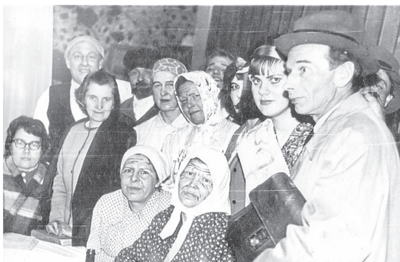
Jumurdas dramatisks kolektīvs 60. gadu beigās.