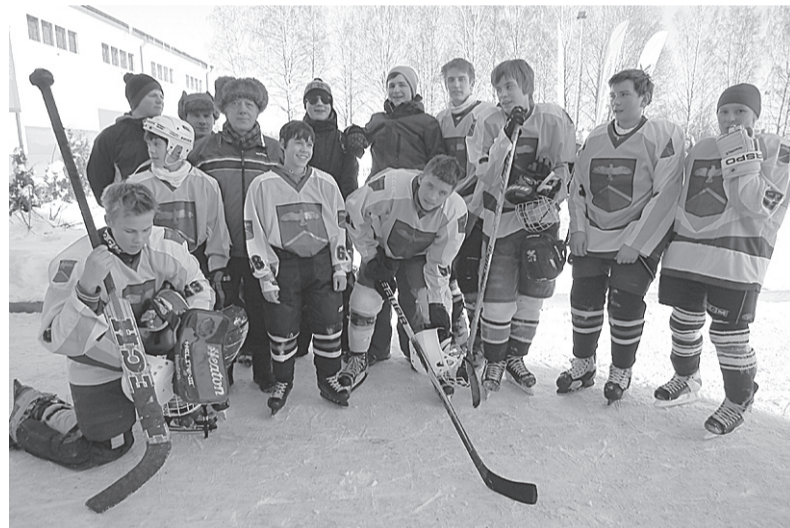
Ērgļu hokeja komanda.