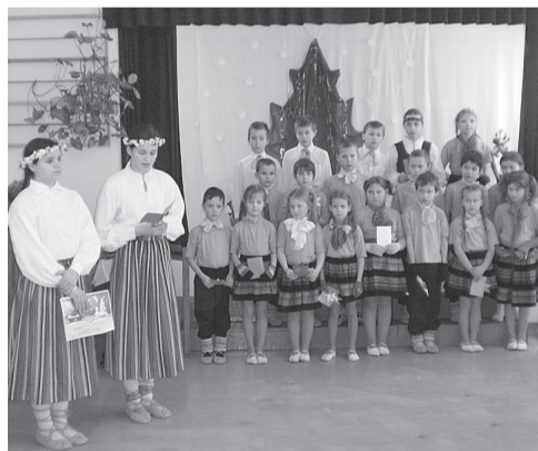
giem par darbu!