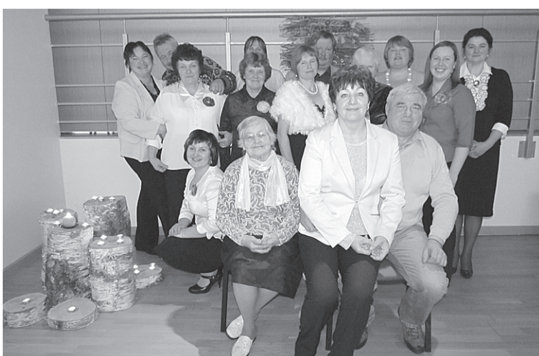
Jumurdas dramatisks kolektīva dalībnieki salidojumā 2012. gadā.