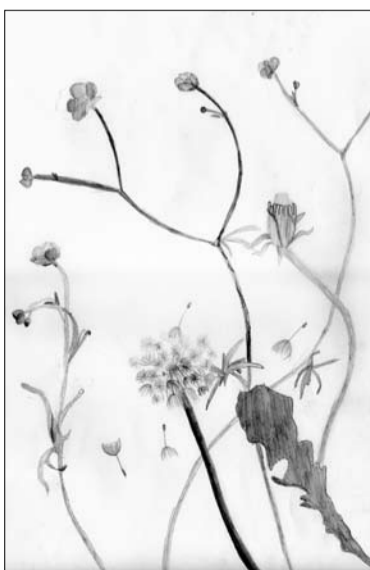
Beāte Rūnika ĒMMS 6.kurss