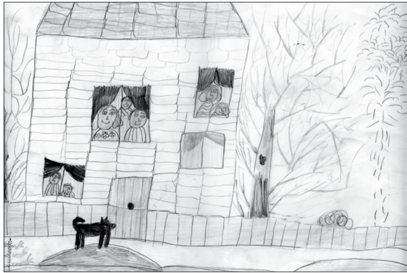
Elīza Hermane ĒMMS 3.kurss