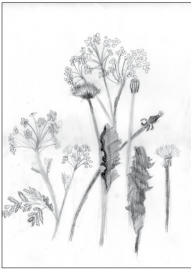
Jēkabs Purviņš ĒMMS 6.kurss