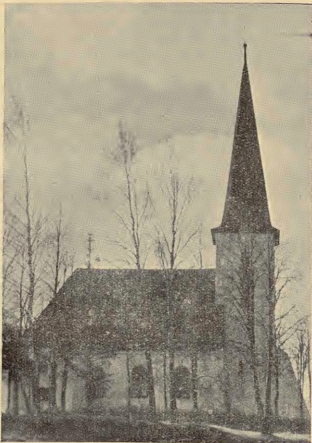
Vārmes draudzes baznīca.