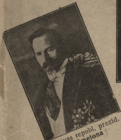
Lietuvos republ. prezid. A. Smetona !