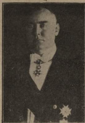
Latvijas valsts prezid. A. Kviesis