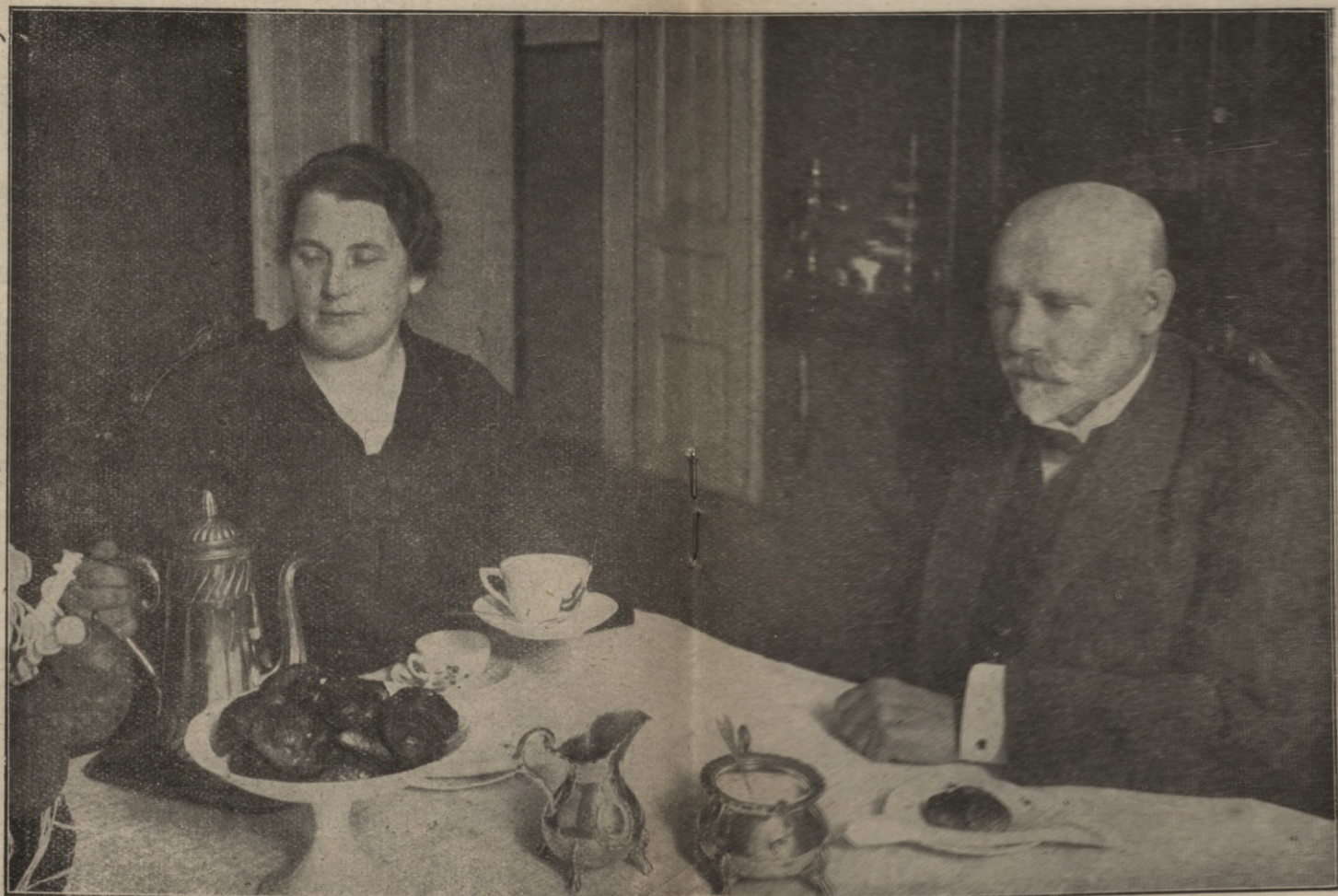
Walfrēds prējden's Jāhnis Sīchafte ar kundšiti pēc tēhjas galda.