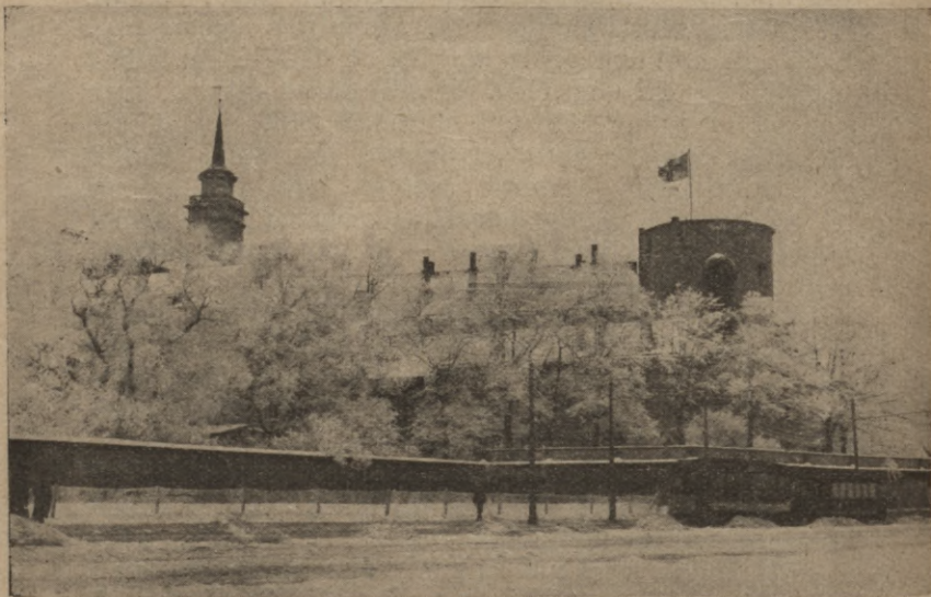
Rigas pils. walts prezidenta bij. mitelis.

Jahnis Tschakste dsimis 14. septembri 1859. gadā, Leelsejawas Tschakstu mahjās. Pabeidsis Jelgawas gjmnastju 1882. gadā un studejis Maskawas uniwersitatē juridiskā fakultatē, kuru beidsis 1886. gadā. Tuhlin pehz augstskolas nobeigšanas, tai paschā gadā