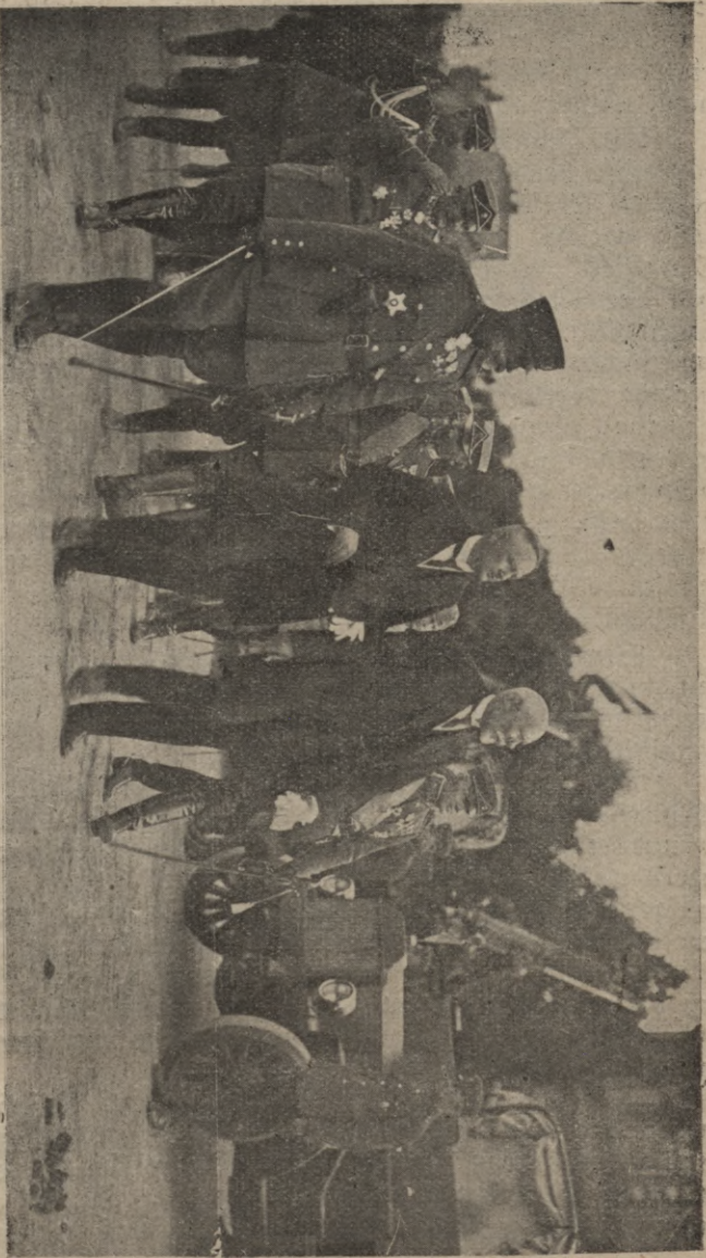
Swafis prezidents ar somu wešfem apfaiģā parades tāhritiba šahwošās karaspēģta daļās.