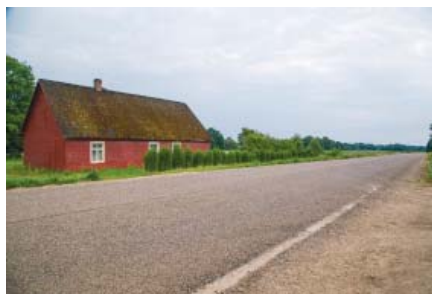
Līdz šim divkārtu virsmas apstrāde ceļam V783 veikta no Lašiem līdz Dūņenieku klubam.

2018. gada 17. janvārī Latvijas Pašvaldību savienības (LPS) Tautsaimniecības komitejas sēdē VAS "Latvijas Valsts ceļi" valdes priekšsēdētājs Jānis Lange informēja par valsts vietējo autoceļu finansējumu 2018. gadā. Šogad valsts autoceļu finansēšanai tiks paredzēti orientējoši 35 miljoni, jo, palielinoties akcizes nodokļa ieņēmumiem, finansējums autoceļiem pieaug par 25.6 miljoniem. Ir sastādīts valsts vietējo autoceļu saraksts, kuriem šogad paredzēts veikt būvdarbus. Šajā sarakstā iekļauts arī Jēkabpils novadā esošais ceļš V783 Jēkabpils – Dignāja – Ilūkste, kur grants seguma divkārtu virsmas apstrāde tiks veikta posmā no 14,30 līdz 20,80 km (kopā 6,50 km).