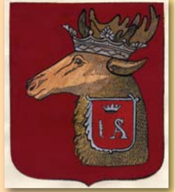
Foto: Jelgavas pilsētas ģerbonis 1846. gadā

Avots: Ģederta Eliasa Jelgavas Vēstures un mākslas muzejs