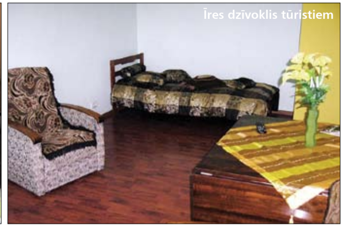
Īres dzīvoklis tūristiem