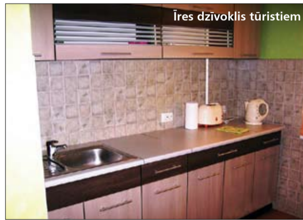
Īres dzīvoklis tūristiem