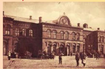
Attēls: Jelgavas stacija

Gandrīz pirms 160 gadiem – 19. gadsimta 50. gados – tika ierosināts būvēt dzelzceļa līniju no Rīgas līdz Jelgavai. Ņemot vērā, ka šādam dzelzceļam Krievijas impērijā būtu provinciālais statuss, atļauja dzelzceļa līnijas būvniecībai netika saņemta. 1863. gadā sekoja ierosinājums būvēt dzelzceļa līniju Rīga-Jelgava-Liepāja, tiesa gan, šāda dzelzceļa līnija tika uzbūvēta tikai Latvijas Republikas laikā: 1925. – 1929. gadā.