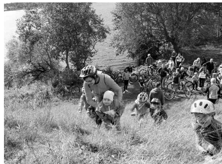
Viens no pērn spilgtākajiem TIC organizētajiem pasākumiem bija velobrauciens apkārt Doles salai, kurā piedalījās gan lieli, gan mazi salaspilieši.

Pa šiem gadiem ir izveidoti Riverway informācijas stendi, informatīvie stendi pie TIC, piemiņas vietu stendi, atjaunoti velomarķē-