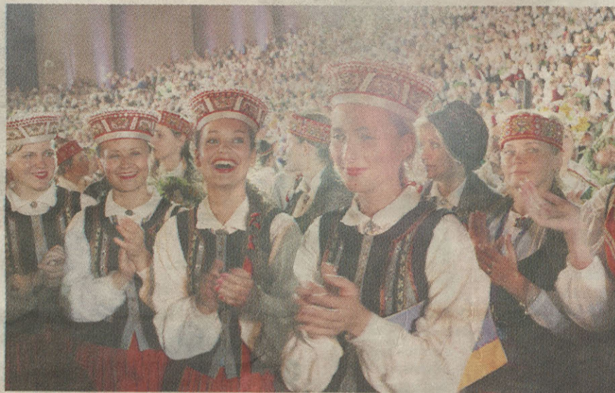
■ Mūsu laika latvietim atbildē uz jautājumu, kas ir mani Dziesmu svētki, parādās aizvien individualizētākas izjūtas un redzējumi.

Ko mums, latviešiem, nozīmē Dziesmu un deju svētki, ir viens no man biežāk uzdotajiem jautājumiem gan žurnālistu intervijās, gan publiskajās diskusijās visā svētku sagatavošanās periodā, kā arī visā garajā posmā kopš svētku starptautiskās atzīšanas. Šodien, pārļaujot savas daudzveidīgās atbildes, kā arī atsaucot atmiņā daudzu mūsu Latvijas personību izteiktās atziņas, jāsaka – vienas vienīgās pareizās atbildes jau nav. Ir kopīgi vispārārtīti atslēgas vārdi par svētkiem kā rituālu tautas dievkalpojumu, tautas garīgā spēka simbolu un nacionālās identitātes stūrakmeni. Dažādos vēstures posmos svētkiem ir bijusi atšķirīga misija. No 1873. gada līdz Latvijas okupācijai 1940. gadā svētki uz-