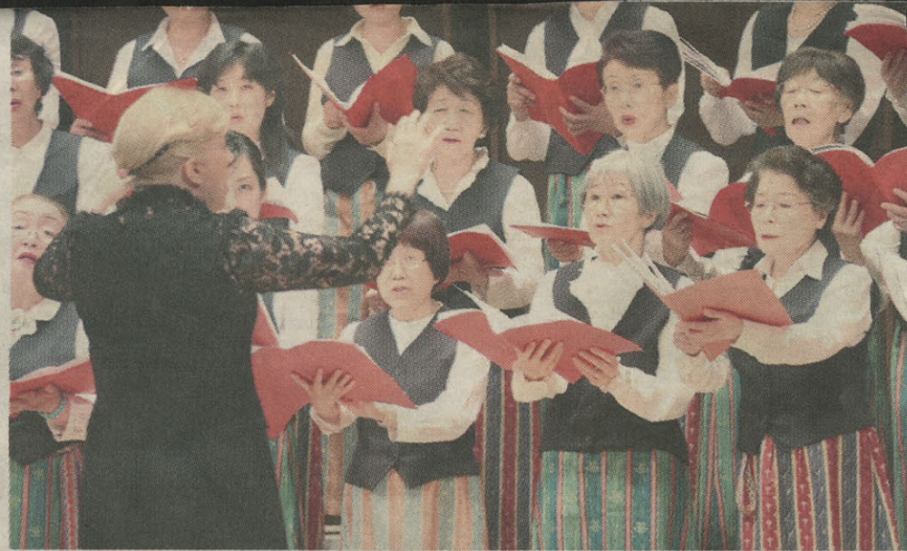
■ Dziesmu svētkiem japāņu koris Gaisma ir gatavojies neatlaidīgi un rūpīgi – šūdinājis jaunus tērpus, iedvesmojoties no latviešu tautastēpiem. Tomēr pēc nolikuma Dziesmu svētkos koris valkās japāņu tautastērpus

Svētku repertuāru koris sācis apgūt no 2012. gada sākuma, tiklīdz bija iespējams iegādāties dziesmu krājumu, un gatavojas tiešām no visas sirds. «Katru reizi, kad ko-