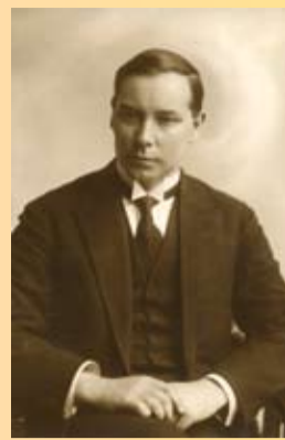
Attēls: Ģederts Eliass