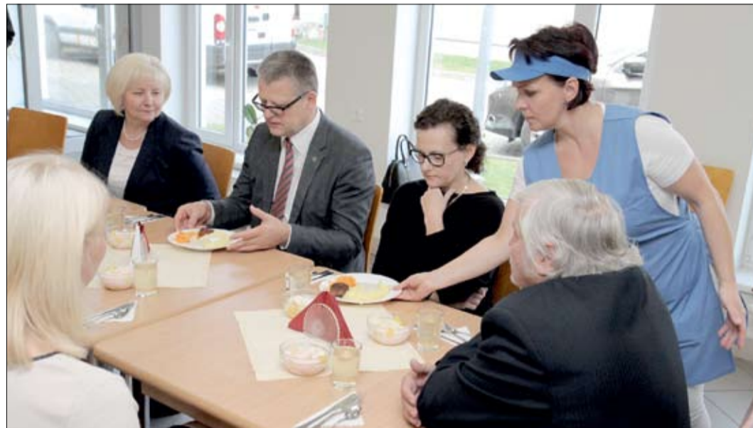
Veselības ministrs Guntis Belēvičs, darba vizītē apmeklējot Jelgavu, akcentēja veselīga uztura nozīmi bērnu un jauniešu ikdienā. «Veselības pamati tiek ielikti agrā bērnībā, un tas lielā mērā atkarīgs no skolas. Tāpēc ir svarīgi tos iemācīt bērnam, lai viņš, aizejot mājās, par veselīga uztura nozīmi izglītotu arī vecākus.» Pārliecināts ministrs, atzinīgi novērtējot 4. vidusskolā nobaudīto maltīti.