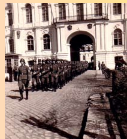
Attēls: Vācu karavīru maršs pie Jelgavas pils

Jelgavā Otrais pasaules karš sākās 1941. gada 23. jūnijā, kad vācu kara aviācija bombardēja Jelgavas aerodromā esošās padomju kara lidmašīnas. 29. jūnijā Jelgavu okupēja vācu karaspēks. Padomju karaspēks atkāpjoties spridzināja dzelzceļa tiltu un sabojāja tiltus pār Driksu un Lielupi.