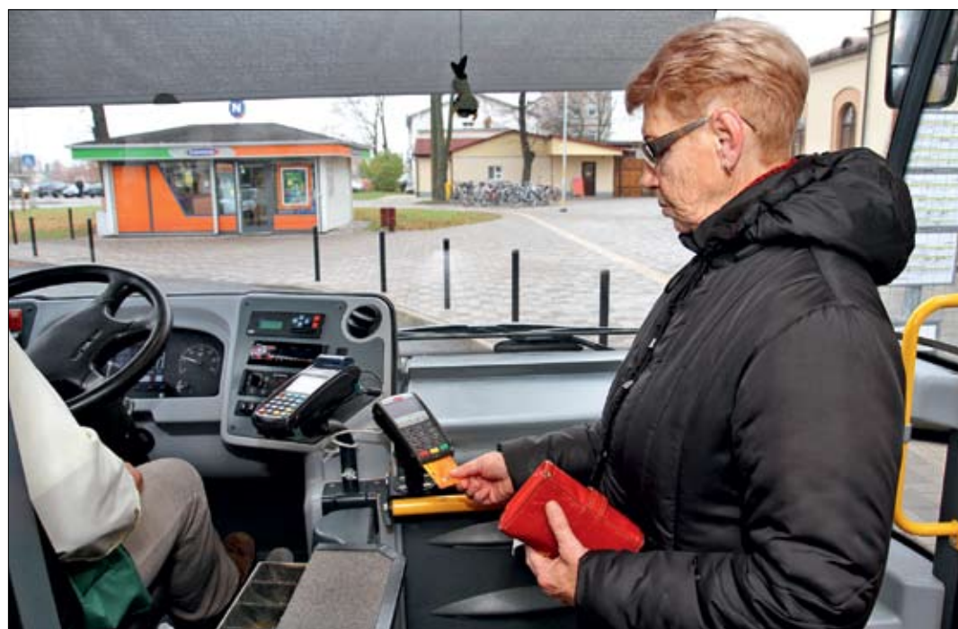
No 1. novembra pasažieri pilsētas autobusus par braucienu var samaksāt arī ar jebkuras bankas «VISA» vai «MasterCard» norēķinu karti. Maksa par braucienu, norēķinoties ar bankas karti, ir 0,85 eiro, bet skaidrā naudā biļetes cena ir 1 eiro.