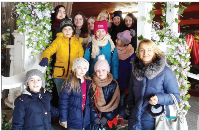
Konkursā "Balsis 2018" Preiļos