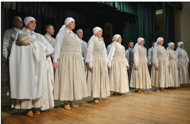
"Tine" jaunajos tērpos