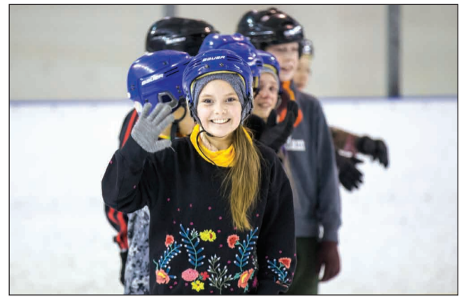
"Ledus gladiatori" – 4. klases divīzija