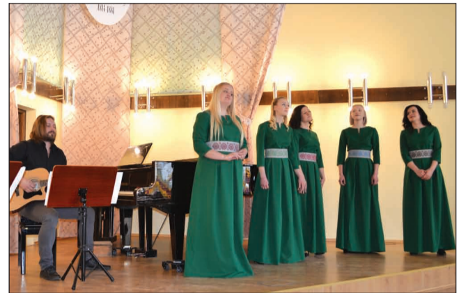
"Melo'dia" vokālo ansambļu skatē