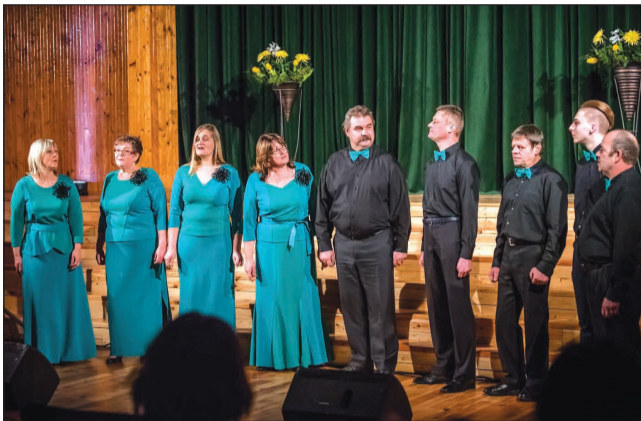
"Vijums" vokālo ansambļu skatē