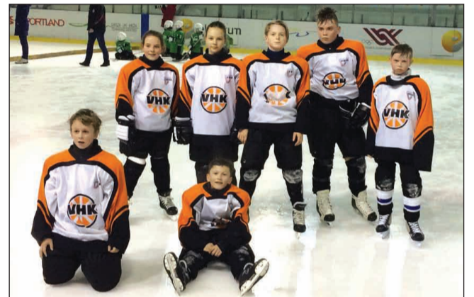
"Zelta ripas" Strenču komanda