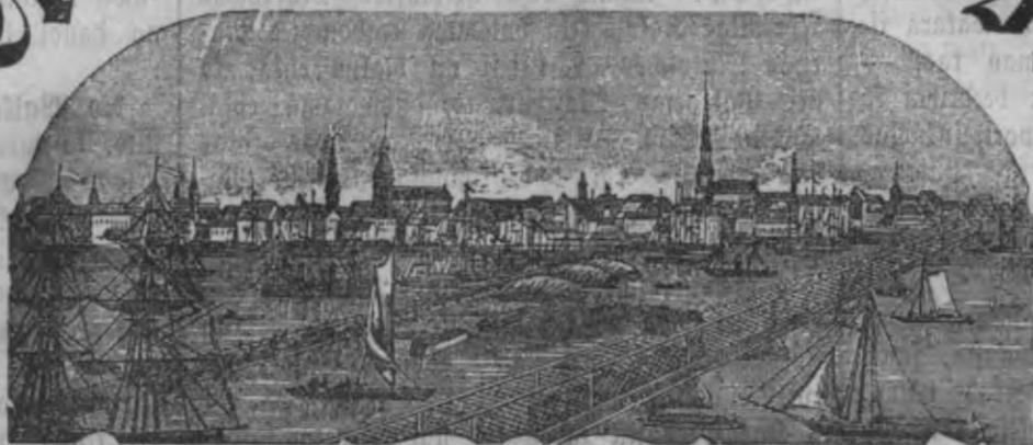
Mahjas Weefis ismahk weenteis pa nedetu.

Maksa bez pefsubstifšanas Rīgā: Ar Peelikumu: par gadu 1 r. 75 L. bez Peelikuma: par gadu 1 " — " Ar Peelikumu: par 1/2 gadu " 90 " bez Peelikuma: par 1/2 gadu " 55 "