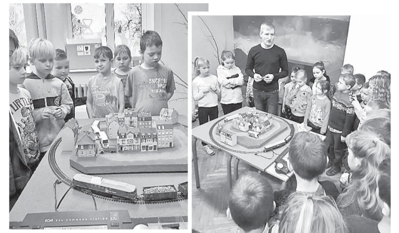
Krustpils pamatskolas skolēni darbībā