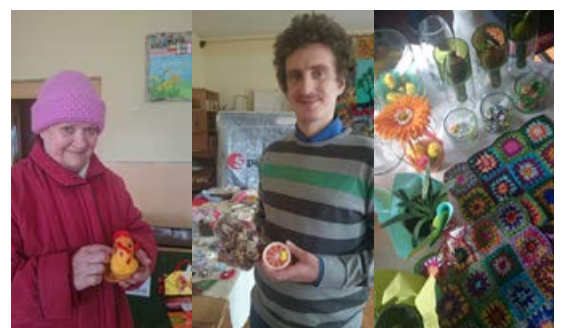
Foto: 1. Neļa Beleviča; 2. Maigurs Skurjats; 3. Ieskaits tirdziņa norisē

Lappusi sagatavoja Jēkabpils NVO resursu centrs