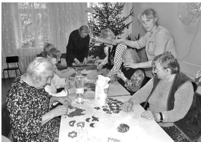
Aprūpes centra iemītnieki cep piparkūkas.

Gaidot Ziemassvētkus, Ērgļu sociālās aprūpes centra iemītnieki izrotāja savas istabiņas ar dekorācijām, svētku eglīti ar skaistiem rotājumiem un elektriskām spuldzītēm, bet visa nama logos Ziemassvētku gaidīšanas laikā iedeva elektriskās sveītes.