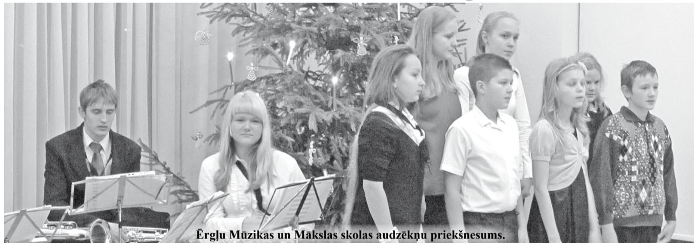
Ērgļu Mūzikas un Mākslas skolas audzēkņu priekšnesums.

Sveicieni visiem jums Jaunajā, 2014., gadā! Lai jūs sirsniņās deg gaiša un mīlestības pilna liesmiņa, kura spēj sasildīt jūs pašus un visus visapkārt! Gads būs tik balts, cik baltas un gaišas domas domāsim, gads būs tik labs, cik laba mēs paši sev un citiem darīsim. Lai mums visiem priecīgiem notikumiem bagāts gads!