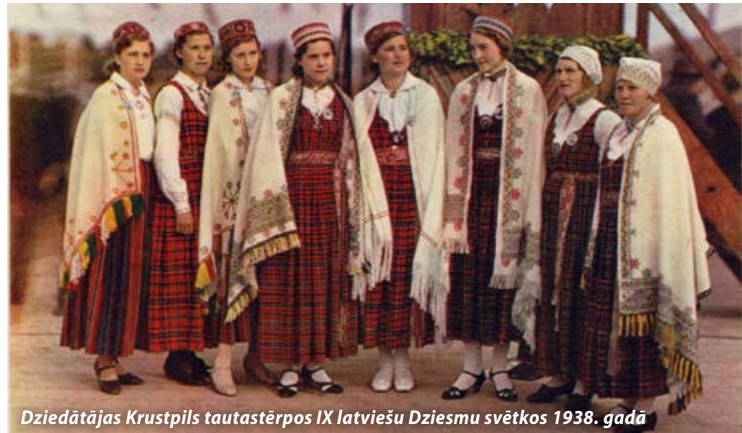
Dziedātājas Krustpils tautastērpos IX latviešu Dziesmu svētkos 1938. gadā

Latvijas simtgades gadā iedzīvotājos arvien vairāk mostas latviskums, piederība savai vietai un tautai. Mūsu tautas skaistākā un krāšņākā vērtība jau kopš seniem laikiem ir tautastērps, kurā latvieši ir strādājuši un rotājušies visos laikos. Arī mūsdienās cilvēki vēlas paust piederību savam novadam, savai dzimtajai vietai, stiprināt to ar savu personīgo tautastērpu.