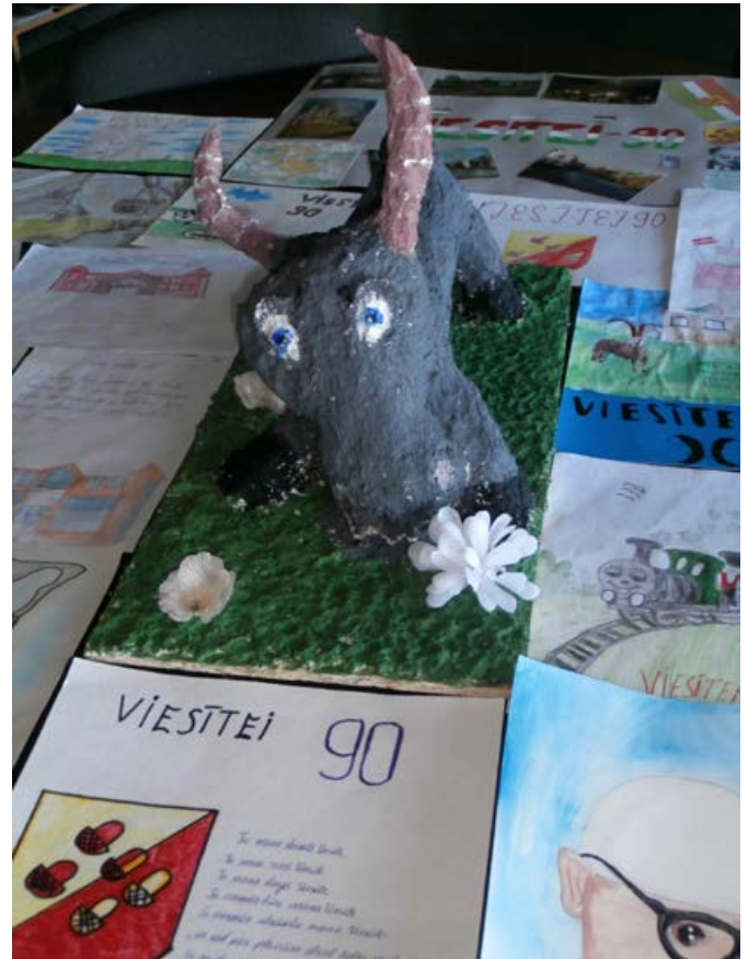
Starp bērnu veltījumiem Viesītei īpaši izcēlās 4.b klases dāvana – āzis.

Plašāks raksts par Viesītes bibliotēku pasākumu „Daudz laimes, Viesīte!” – 18. lpp.