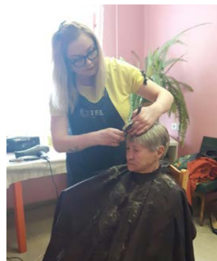
S. Žuka frizē aprūpes centra klienti.