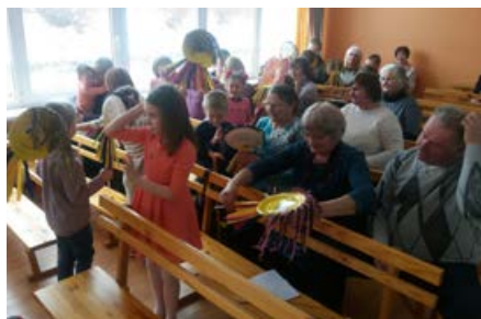
„Bītišu” grupas bērni kopā ar vecmāmiņām un vectētiņiem.

Kad ziema kārtro ceļa somu, bet gaisā smaržo jau pavasaris, klāt ir marta mēnesis. Viesītes PII „Zilīte” marts vienmēr ir gaidīts ar nepacietību. Tas ir ipašs, jo bērni ar sarūpētām dāvanām gaida ciemos savas miļās vecmāmiņas un vectētiņus uz Vecvecāku pēcpusdienu.