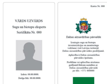
Attēls Nr.1 Eksperta apliecības paraugs

Satiekot savā īpašumā ekspertu ar Dabas aizsardzības pārvaldes iesniegto apliecību (attēls Nr.1), zemes īpašniekam ir tiesības piedalīties īpašuma apsekošanā un uzdot par to jautājumus, bet eksperta paustais skaidrojums par dabas vērtībām ir tikai informatīvs. Ja Jūsu īpašumā tiks konstatēts ES nozīmes biotops, pēc datu kvalitātes pārbaudes 2019. gadā saņemsiet Dabas aizsardzības pārvaldes rakstisku informāciju.