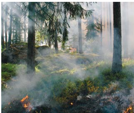
Valsts meža dienests ar 27. aprīli izsludinājis ugunsnedrošo periodu mežā.

Ugunsnedrošajā periodā mežā aizliegt veikt jebkādu dedzināšanu, ugunsiskus atļauts kurināt tikai īpaši uguns kuriem ierīkotās vietās, aizliegts pārvietoties ārpus meža ceļiem ar motorizētiem transportlīdzekļiem. Jebkuri dedzināšanas darbi mežā vai tā tiešā tuvumā jāaskaņo ar Sēlijas virsmežniecības darbiniekiem.