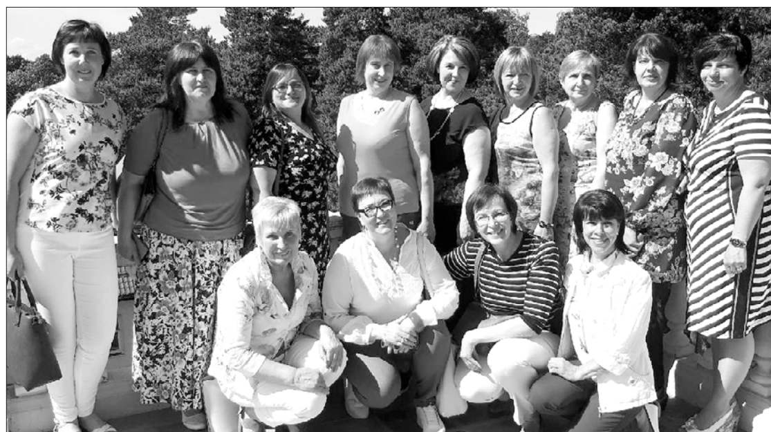
Ventspils novada pārstāves devās pieredzes apmaiņas braucienā.