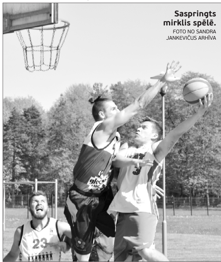
Saspringts mirklis spēlē.

Spēle par 1. vietu tikās “Agris ar dūziem” un “Taverna” – komandas, kuras līdz finālam nebija zaudējušas nevienu spēli apakšgrupās. Ar rezultātu 17:21 par Popes kausa