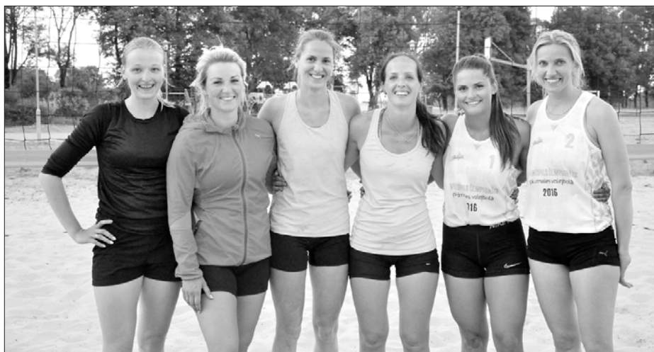
Sportiskās dāmas spēlēja pludmales volejbolu.