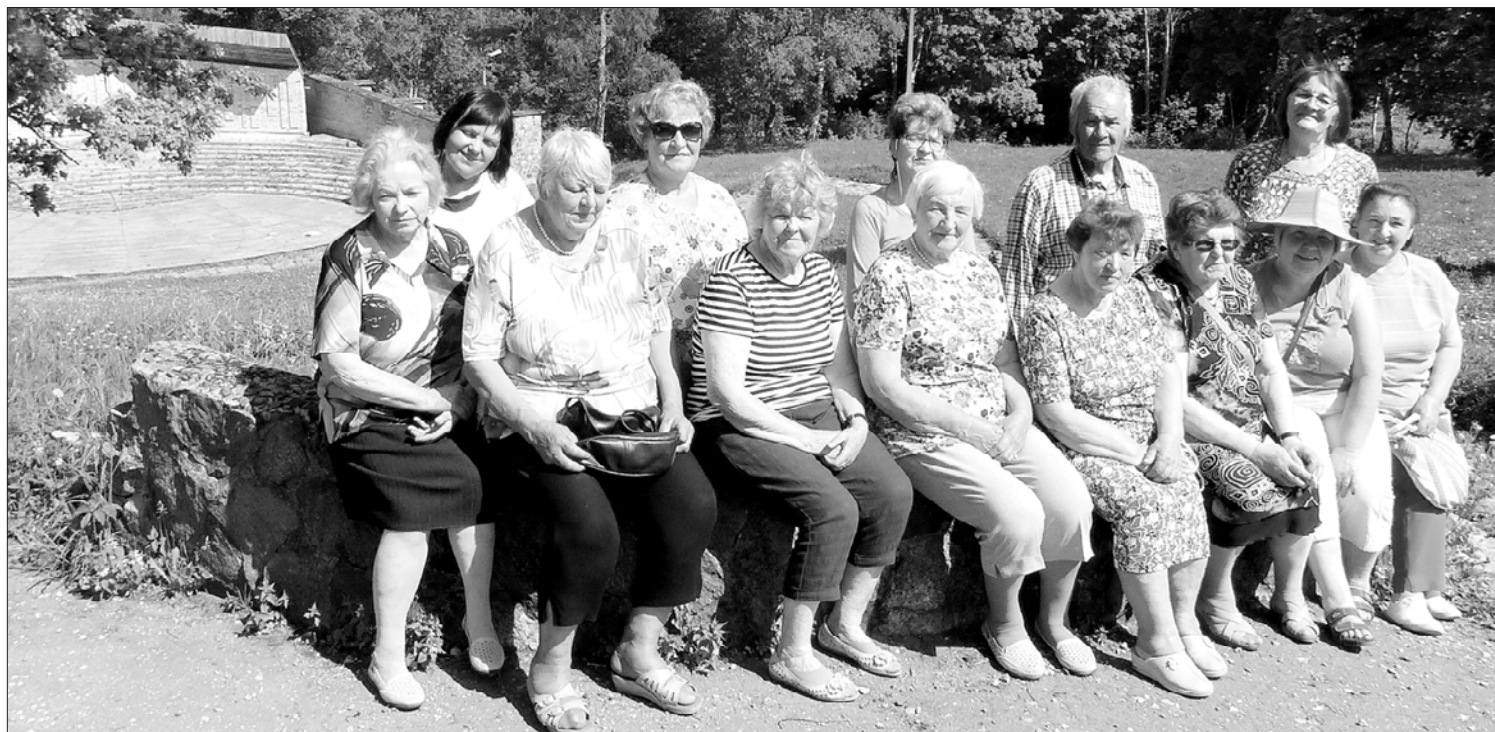
Pužiņi apskatījuši Popes estrādi.