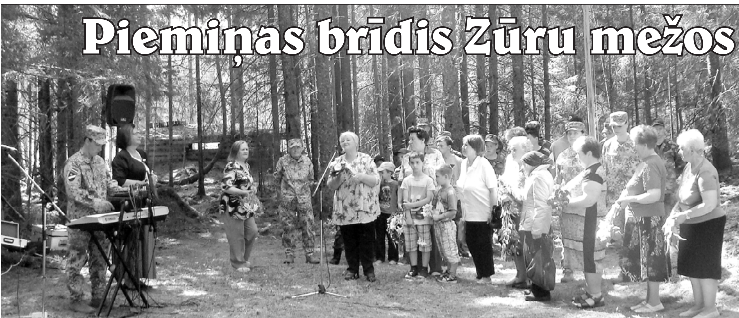
Zūru mežā kritušos tautiešus piemin Vārves pagasta iedzīvotāji.