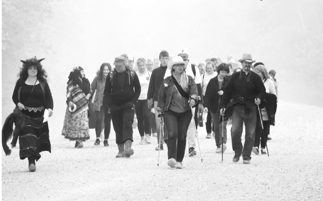
Tā nav migla, kas redzama fonā, tie ir automašīnas saceltie putekļi.