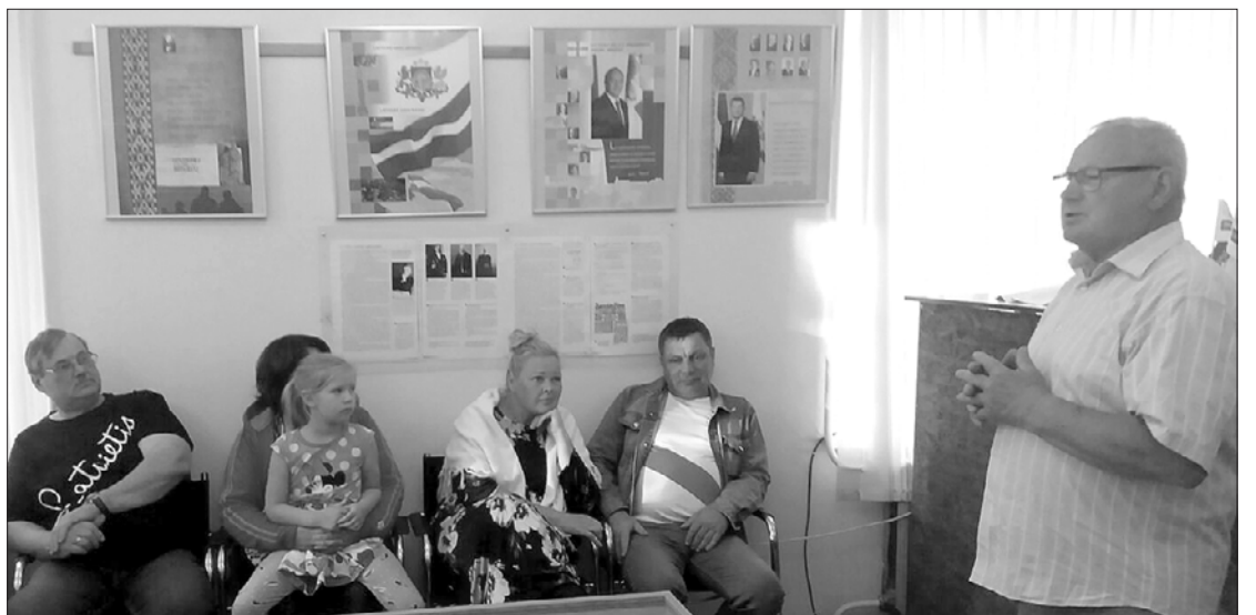
Jānis Freimanis stāsta par Latvijas valsts tapšanu.