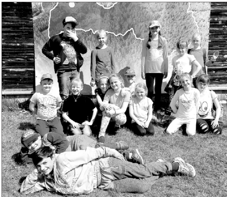
Užavas 1.–3. klašu audzēkņi iepazīst mežu.