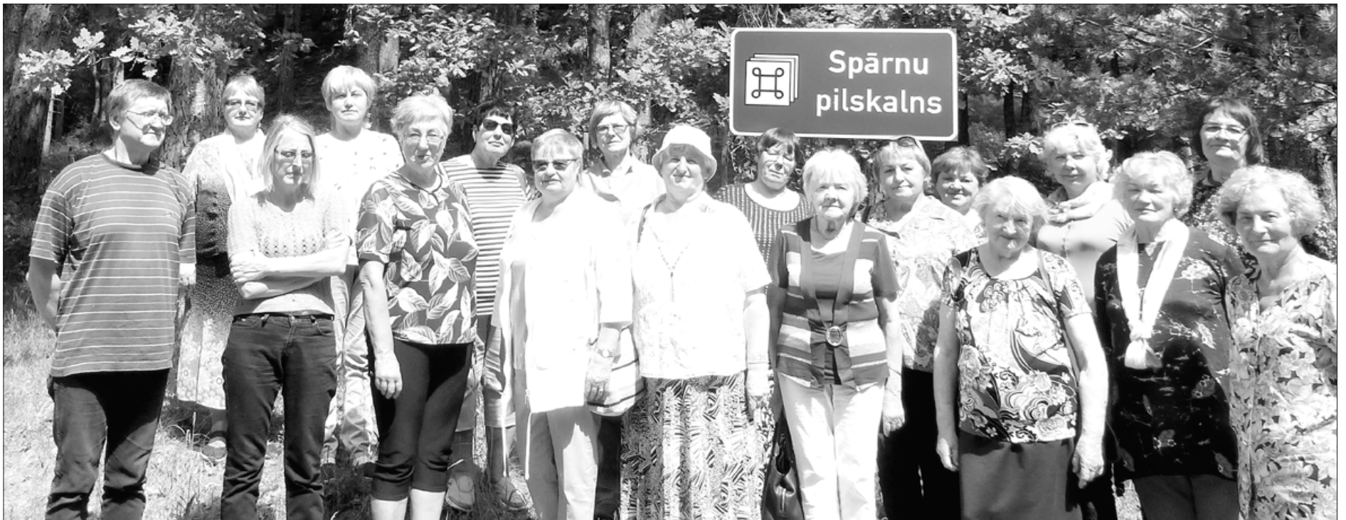
Sieviešu biedrības "Spārni" aktīvistes devušās izbraukumā.