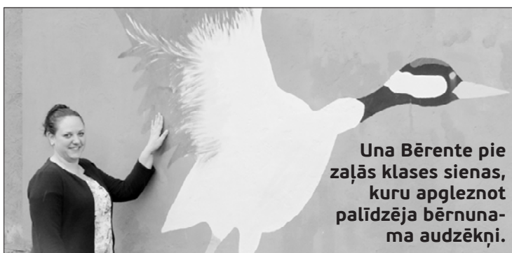
Una Bērente pie zaļās klases sienas, kuru apgleznot palīdzēja bērnuma audzēkņi.