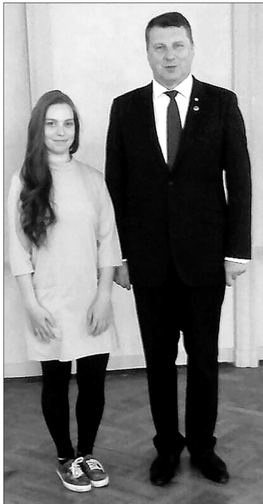
Betija kopā ar Valsts prezidentu.