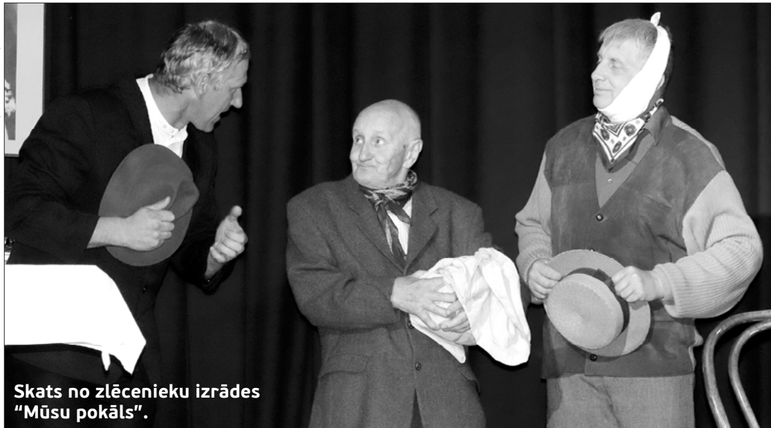
Skats no zlēnieku izrādes "Mūsu pokāls".

tik svarīgi – apzināties, ka katrs amatieru teātris ir galvenais garīgās gaismas nesējs savā pagastā, tāpēc ir jādodomā ne tikai par savu skatītāju smidzināšanu, bet arī par to, ar kādu jaunu atziņu, ar kādu iegūtu atbildi uz jautājumu skatītājs aizies mājās. Svarīgi ir tas, lai režisors zina, par ko viņš grib runāt uz skatuves, un atrod veiksmīgāko veidu, kā ar aktiera palīdzību to izdarīt. Te vislabāk palīdz pamatīga un dziļa lugas analīze, jo tikai tad, ja aktieris zina, par ko režisors grib runāt ar skatītāju, būs vēlamais rezultāts. Aktieris un režisors ir viens vesels orga-