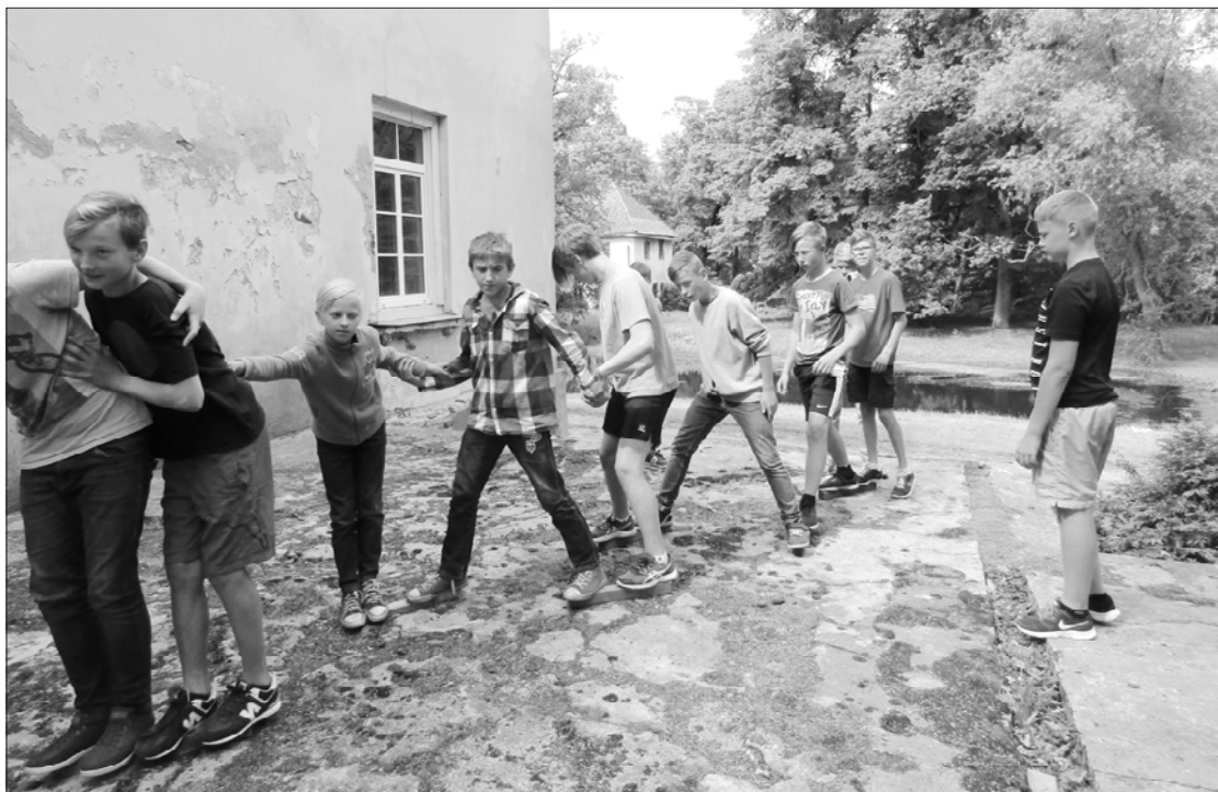
Zēni mācās darboties komandā.

Otrā bija āra aktivitāte, komandas piedalījās dažādos interesantos uzdevumos, mācoties sadarboties, komunicēt, sadalīt uzdevumus un