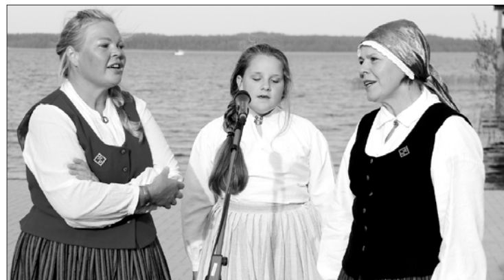
Tautasdziesmu spēkā ieskanas folkloras kopas "Pill tīn" dziedātāju balsis.