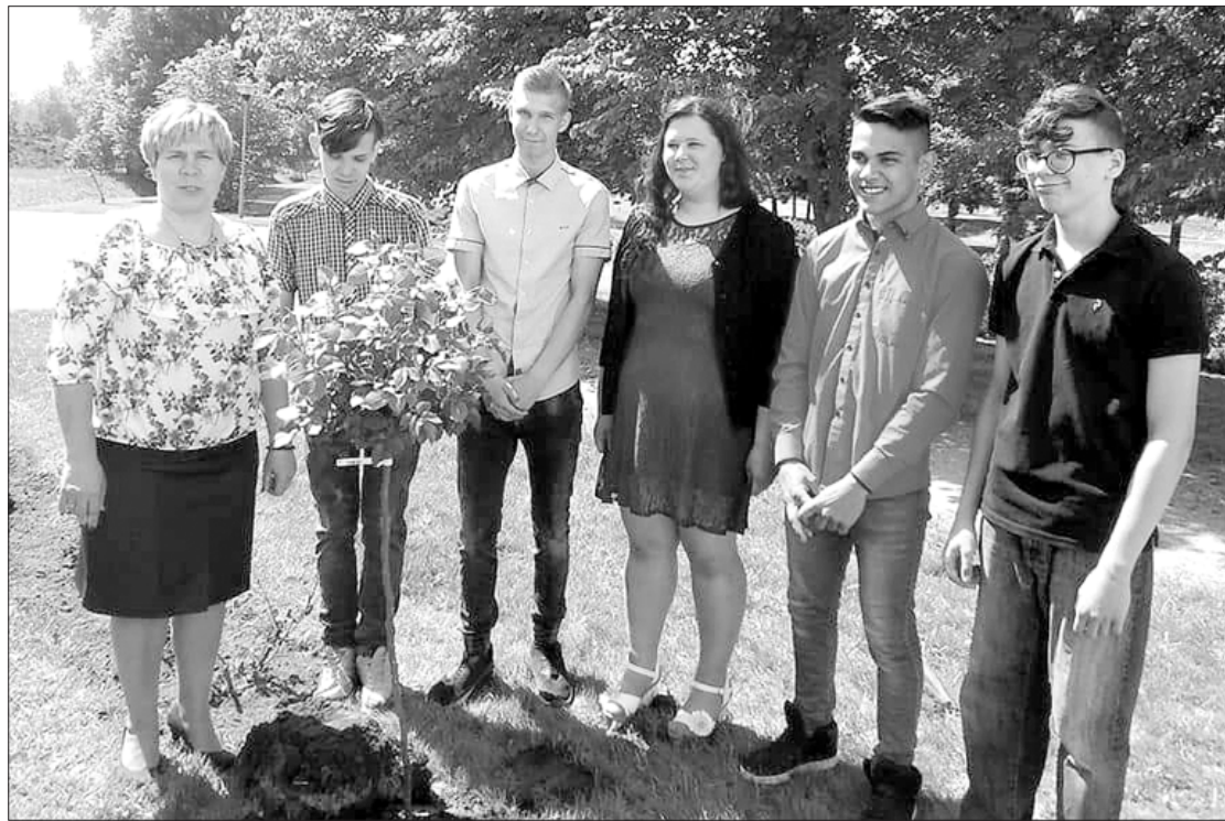
9. klases skolēni ar audzinātāju, izskanot pēdējam skolas zvanam.