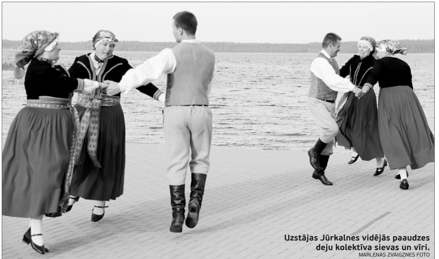
Uzstājas Jūrkalnes vidējās paaudzes deju kolektīva sievietes un vīri.