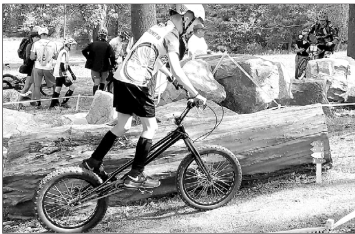
Trasē – jaunais “Kartera” sportists.