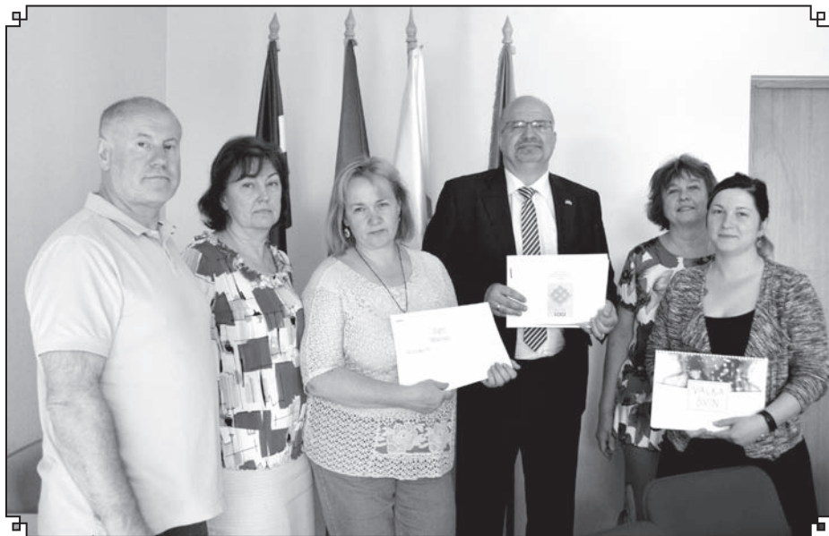
Tuvākajā laikā novada iedzīvotājus sagaida jauni un interesanti elementi pilsētvidē.