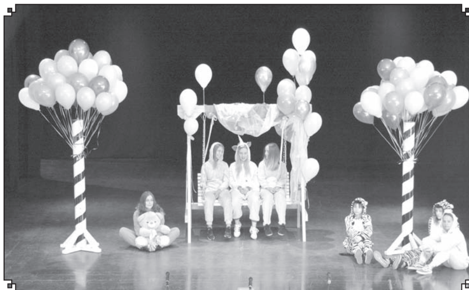
Sudraba laimes karotīšu svētki - viena no visskaistākajām tradīcijām novadā

Atgādinu, ka tās ģimenes, kuras nevarēja ierasties svētkos, aicinātas saņemt sudraba karotītes Valkas novada Dzimtsarakstu nodaļā Beverīnas ielā 3, Valkā. ☼