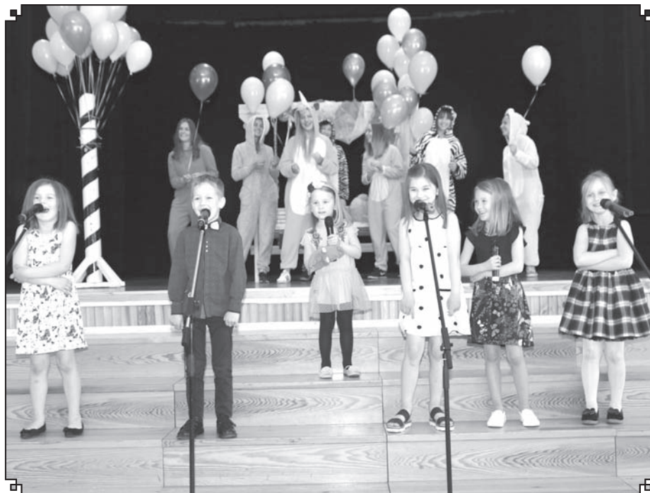
Viesus izklaidēja bērnu vokālais ansamblis «Mazais vilcieniņš».