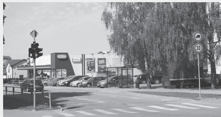
Rīgas un Jūrmalas ielu krustojums Piņķos.

Babītes novada pašvaldības ceļu būvzinieciere