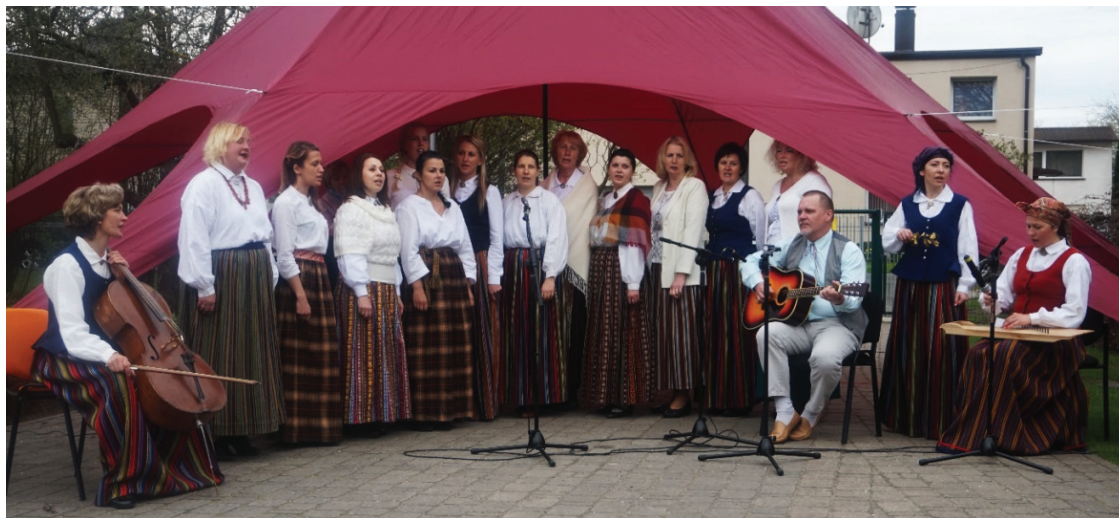
Babītes PII darbinieku vokāli instrumentālais ansamblis.

Babītes pirmsskolas izglītības iestādes vadītājas vietniece izglītības jomā