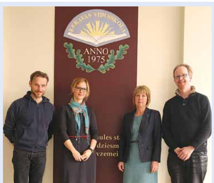
Bordesholmas pārstāvji viesojas Ķekavas vidusskolā.