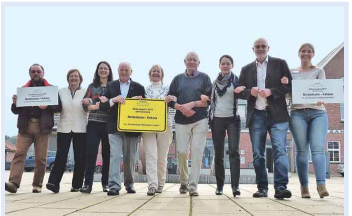
Ķekavas novada pašvaldības delegācija Bordesholmā.

Izglītības iestāžu sadarbība starp Ķekavas vidusskolu un reālskolu Bordesholmā iesākās jau pirms pa-