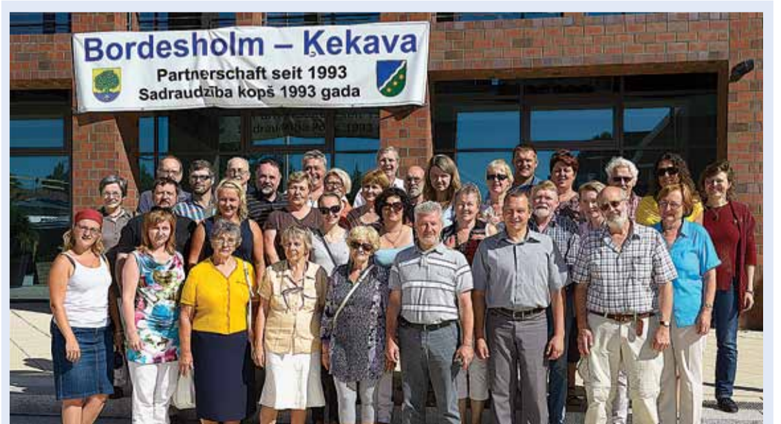
Ķekavas novada delegācijas vizīte Bordesholmā 2013. gadā, atzīmējot sadraudzības 20. gadskārtu.

Pirmās publikācijas par sadraudzības Bordesholmas avīzē „Bordesholmer Rundschau”.