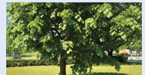
No Bordesholmas atvestajai liepiņai jau 18 gadi.