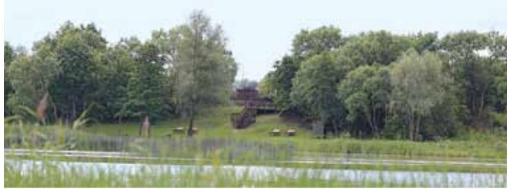
Skats uz atpūtas vietu pie Dārznieka.

Rezultātā secināts, ka novada teritorijā Daugavā, Ķekavas upē un Titurgas ezerā ūdens ir tīrs un peldēšanai drošs, paraugi atbilst peldēšanu normatīviem.