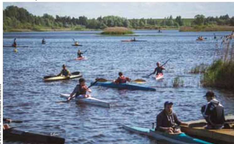
Sacensībās startēja gandrīz 100 jauniešu.

19. maijā jauniešus no septiņām Latvijas pilsētām jau otro reizi Ķekavā pulcēja gludūdens airēšanas meistarsacīkstes un Ūdensmalas festivāls jauniešiem.