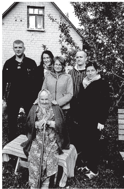
Veriņa ar saviem mīļajiem.

nas ir tās dienas, kad atbrauc mīļie, spēcinoši ir viņu teiktie vārdi, siltie apskāvienu. Lai Veriņai stipra veselība, možs gars un dzīves spars!