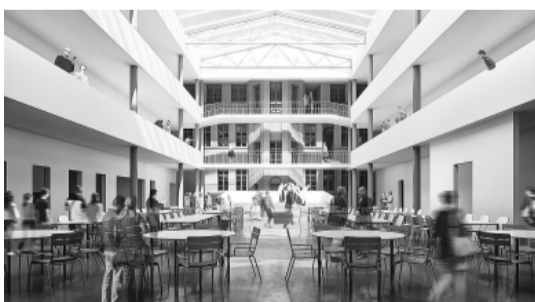
Smiltenes vidusskolas vidējā mācību korpusa iekšējās fasādes pārbūves skice.