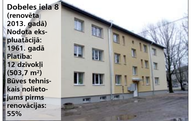
Dobeles iela 8 (renovēta 2013. gadā) Nodota ekspluatācijā: 1961. gadā Platība: 12 dzīvokļi (503,7 m 2 ) Būves tehniskais nolietojums pirms renovācijas: 55%

Neapšaubāmi, efektīvāks veids, kā nodrošināt pienācīgu gaisa apmaiņu, ir rekuperācijas sistēmas uzstādīšana mājā, taču, kā norāda O.Kukuts, šādas sistēmas izbūve atsevišķos gadījumos var izmaksāt tikpat, cik visi renovācijas darbi kopā. Krievu lētāka alternatīva varētu būt gaisa pieplūdes vārstu izbūvēšana, kas nodrošinātu