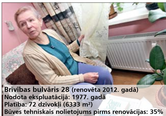
Brīvības bulvāris 28 (renovēta 2012. gadā) Nodota ekspluatācijā: 1977. gadā Platība: 72 dzīvokļi (6333 m 2 ) Būves tehniskais nolietojums pirms renovācijas: 35%

Ši ir pirmā apkures sezona, ko renovētā mājā aizvada Raiņa ielas 9 iedzīvotāji. Darbu lietderību un mājas energoefektivitāti apliecina siltuma rēķini – lielākais rēķins pagājušajā apkures sezonā vēl pirms renovācijas saņemts decembrī, un tas bija 1,52 latu par kvadrātmētru, savukārt aukstajā janvārī šogad iedzīvotāji maksājuši tikai 0,84 eiro jeb 59 santimus par kvadrātmētru.