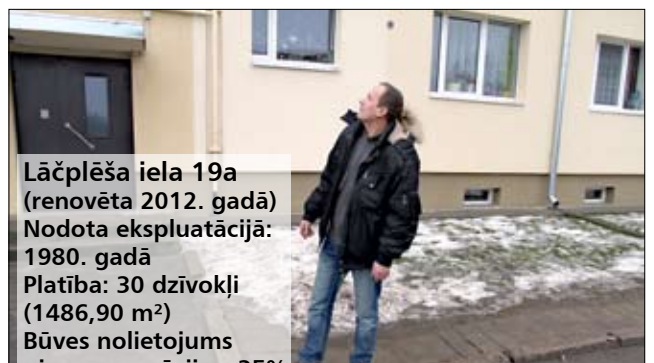
Lāčplēša iela 19a (renovēta 2012. gadā) Nodota ekspluatācijā: 1980. gadā Platība: 30 dzīvokļi (1486,90 m 2 ) Būves nolietojums pirms renovācijas: 35%

Sākotnēji bija plānots, ka Dobeles ielā vienlaicīgi tiks rekonstruētas četras līdzīgas mājas, kas atrodas cita citai blakus, taču līdz reāliem siltināšanas darbiem tika vien divas – Dobeles iela 8 un 12. Ar to, ka izmaksas būs augstākas nekā citu renovēto māju iedzīvotājiem, Dobeles ielā 8 dzīvojošie rēķinājās jau sākumā, jo māja ir neliela – vien 12 dzīvokļi. «Mana dzīvokļa platība ir 42,3 kvadrātmetri, un decembra rēķins par siltumu bija 27 eiro,» atklāj kāda iedzīvotāja, lēšot, ka renovācijas darbi varētu izmaksāt ap 5000 latu no viņas dzīvokļa.