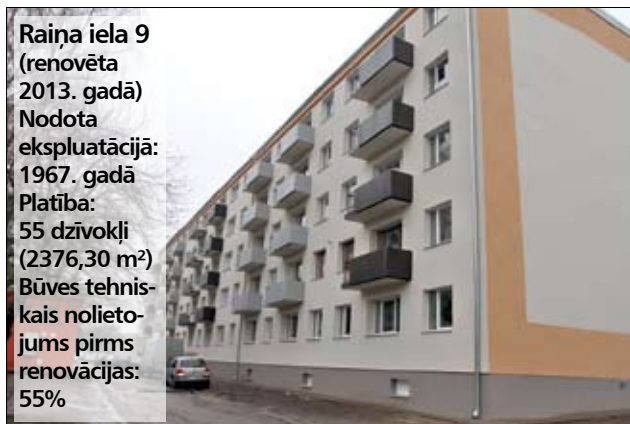
Raiņa iela 9 (renovēta 2013. gadā) Nodota ekspluatācijā: 1967. gadā Platība: 55 dzīvokļi (2376,30 m 2 ) Būves tehniskais nolietojums pirms renovācijas: 55%

Ši ir pirmā apkures sezona, ko renovētā mājā aizvada Raiņa ielas 9 iedzīvotāji. Darbu lietderību un mājas energoefektivitāti apliecina siltuma rēķini – lielākais rēķins pagājušajā apkures sezonā vēl pirms renovācijas saņemts decembrī, un tas bija 1,52 latu par kvadrātmētru, savukārt aukstajā janvārī šogad iedzīvotāji maksājuši tikai 0,84 eiro jeb 59 santimus par kvadrātmētru.