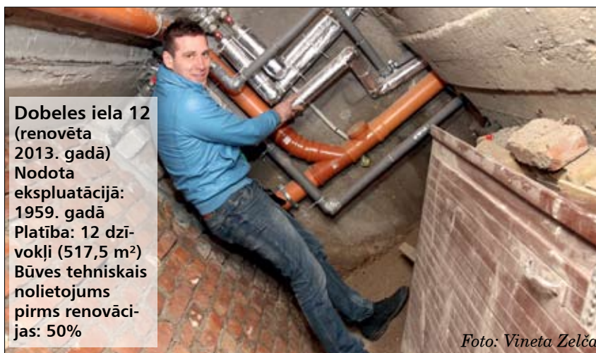
Dobeles iela 12 (renovēta 2013. gadā) Nodota ekspluatācijā: 1959. gadā Platība: 12 dzīvokļi (517,5 m 2 ) Būves tehniskais nolietojums pirms renovācijas: 50%