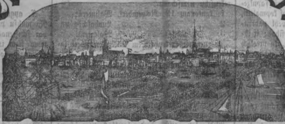
Mahjas weefis isnabt weentel pa nedeku.

Maksa ar peesubstancas Riā: Ar peesikumu: par gabu 1 r. 75 L. Ar peesikumu: par gabu 1 " 90 " Ar peesikumu: par 1/2 gabu " 55 "