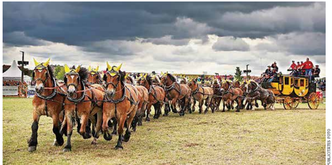
Zirgu karavāna mēros 2300 kilometru garu ceļu.

Unikāla projekta „Titānu tūre: No Briges līdz Novgorodai” („Titanen on Tour: Von Brügge bis Nowgorod”) ietvaros zirgu karavāna ar 10 zelta ratiem un 20 zirgiem šķērsos vairāk nekā 2300 kilometru no Vācijas līdz Krievijai, pietājot vairākās vietās, tostarp Ķekavā, lai priecētu iedzīvotājus un simboliski nestu vēstījumu par mieru, sadraudzību un brīvību vienotā Eiropā.