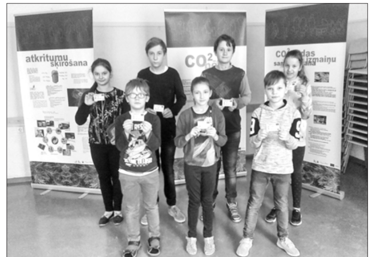
Dzērves pamatskolas skolēni pēc nokārtotā eksāmena

Man ir piecpadsmit gadu, velosipēda vadītāja tiesības jau no 10 gadu vecuma. Man ir velosipēds, kurš ir labā tehniskā stāvoklī: labas bremzes, skaņas signāliņš, gaismas atstarotāji-priekšā balts, spieķos oranžs, aizmugurē sarkans. Dzīvoju 10 km no Aizputes, tāpēc man velosipēds ir ļoti vajadzīgs. Esmu iemācījies labi braukt, perfekti ievēroju satiksmes noteikumus. Braucot lietoju arī galvas aizsargķiveri. Teorētisko sagatavotību un braukšanas māku esmu apguvis Aizputes novada Skolēnu jaunrades centra Jauno satiksmes dalībnieku pulciņā, par ko esmu pateicīgs šīs iestādes pedagogiem. Ar velosipēdu gatavojos doties ceļojumā organizētā braucienā pa Latviju, jo ar manām velosipēda vadītāja tiesībām var braukt pa visu Eiropu.