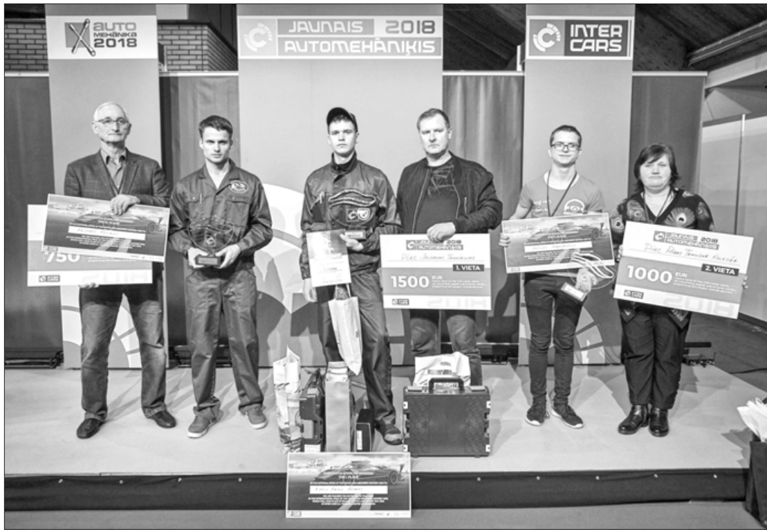
Jauno automehāniķu konkursa uzvarētāji

Katru gadu tiek organizēti dažādi konkursi profesionālās izglītības izglītojamiem, lai noteiktu labākos speciālistus nozarēs, kā arī skolas, kuras var lepoties ar saviem