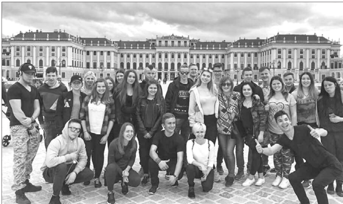
Praktikantu grupa Vīnē (foto no arhīva)

Pavasaris jau klāt, un mācību process skolās kļūst saspringtāks, jo tuvojas vasara, eksāmeni un nobeiguma darbi. Erasmus+ projekts "Kandavas Lauksaimniecības tehnikuma audzēkņu mobilitāte Eiropā" Nr. 2017-1-LV01-KA102-035308 Cīravas struktūrvienībai drīz beigsies, jo 25. aprīlī audzēkņi atgriezīsies no prakses Austrijā. Katru gadu audzēkņiem tiek piedāvāta iespēja doties uz ārvalstīm, lai gūtu jaunu praktisko pieredzi, papildus sniedzot kultūras baudījumu, personības attīstību dažādās jomās un uzlabotu valodas zināšanas, jo projekta mērķis ir sagatavot dažādu jomu speciālistus