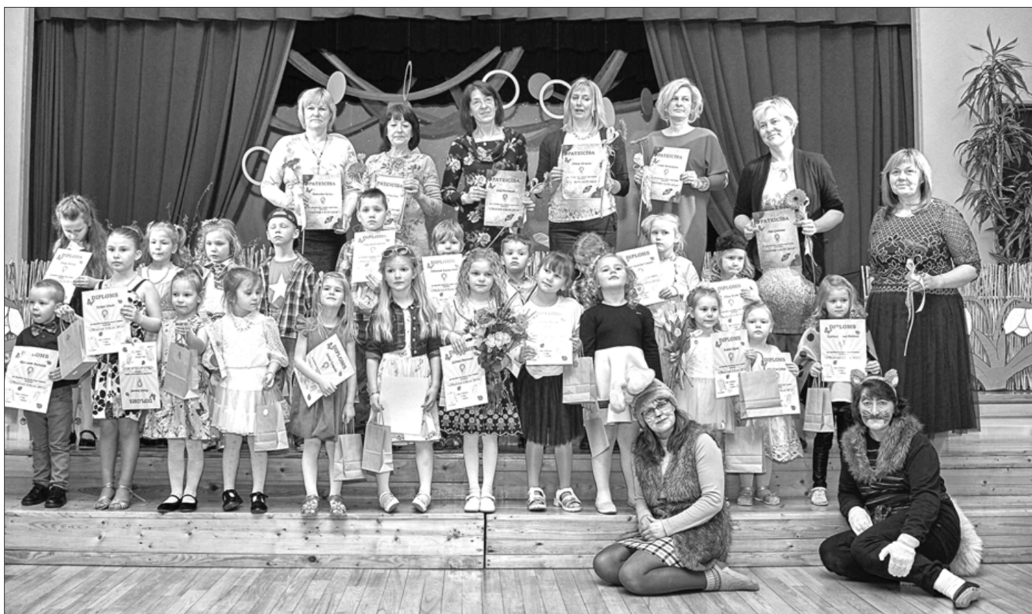
Mazo vokālistu konkursa "Cīravas Cālis 2018" dalībnieki

Mazo vokālistu konkurss "Cīravas Cālis 2018" Cīravā jau kļuvis par ikgadēju tradīciju un pulcē mazos dziedātājus no visa