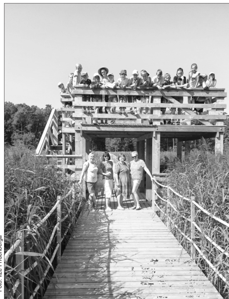
Nometnes dalībnieki pārgājiena laikā Kazdangā

Arī šogad aktīvi Aizputē ar Aizputes novada domes atbalstu darbojas skolēnu vasaras dienas nometne “Iepazīsti sevi!”. Laikā no 23. jūlija līdz 3. augustam tā tiek organizēta divās maiņās (katrā maiņā 25 bērni vecumā no 7–13 gadiem). Par nometnes norises vietu izvēlēta Aizputes vidusskola un skolēnu Jaunrades centrs. Nometnē skolēni no Aizputes un Aizputes novada daudzveidīgi pavada savu brīvo laiku, piedaloties dažādās aktivitātēs: radošās darbnīcas, lomu spēles, spēles dabā, izzinošas spēles, pārgājieni, peldēšana, izstāžu un muzeja apmeklējumi, kā arī tiek apgūtas praktiskas iemaņas sadzīvei. Nometnes noslēgumā tiek rīkota ekskursija uz Ventspili.