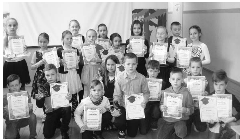
Alojas, Limbažu un Salacgrīvas novadu gudrākie otrklasnieki konkursa noslēgumā.

Sirsnīgā tikšanās aizritēja nemanot, iepazīt ļoti lielisku, erudītu cilvēku. Rakstniece bija atbraukusi ar grāmatu dāvinājumu savas daiļrades cienītājiem, noslēgumā tika dalīti arī autogrāfi.