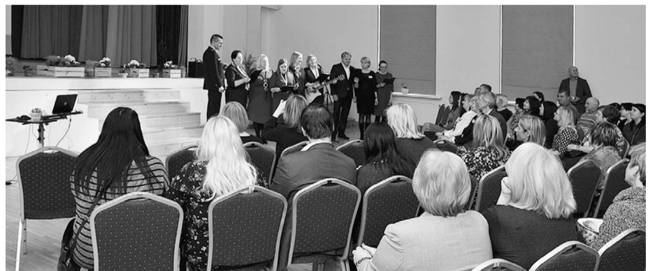
Mārupieši sagaida Alojas novada kolēģus ar muzikālu sveicienu.

5. aprīlī Alojas novada domes darbinieki, iestāžu vadītāji un uzņēmēji devās pieredzes apmaiņas braucienā uz Mārupes novadu.