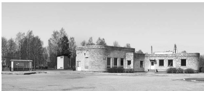
Pašvaldības iegādātais nekustamais īpašums Aļoju, Valmieras ielā 4.

Februāra domes sēdē deputāti aktualizēja jautājumu par autoostas ēkas un laukuma izmantošanu. Tā, ka ēka un laukums ir stratēģiski nozīmīgs objekts un pašvaldībai būtu jādomā par tā izmantošanu infrastruktūras un iedzīvotāju ērtību uzlabošanā, iepriekš aktualizēja arī iedzīvotāju sanāksmēs Aļoju un Vilzēnos. Tāpat aktualizēja galvenokārt uztrauca tas, ka, gaidot autobusu, nav iespējams patverties no nelabvēlīgajiem laika apstākļiem un tuvumā nav mūsdienām atbilstošu labierīcību. Problēmu pašvaldībai radīja arī apkārtnes sakopšanas jautājums, jo zemei un ēkai bija cits īpašnieks, tāpēc nebija pamatotas tiesības šo teritoriju attīrīt no sniega un veikt citus apkārt-