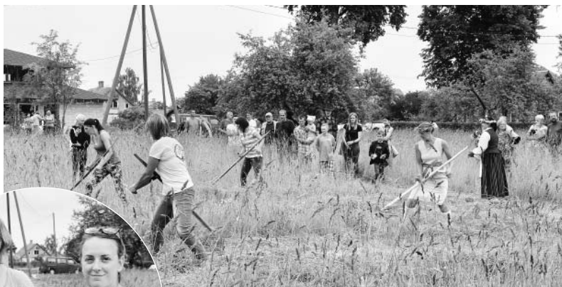
Pļaušanas prasmes komandu disciplīnā rāda sievietes.

Alojas novada pļaušanas svētkus organizēja Alojas kultūras nams sadarbībā ar biedrību „Alojas novada attīstība”. Tos rīko kopš 2009. gada ar mērķi popularizēt izkapt pļaušanas prasmi un Vasa-