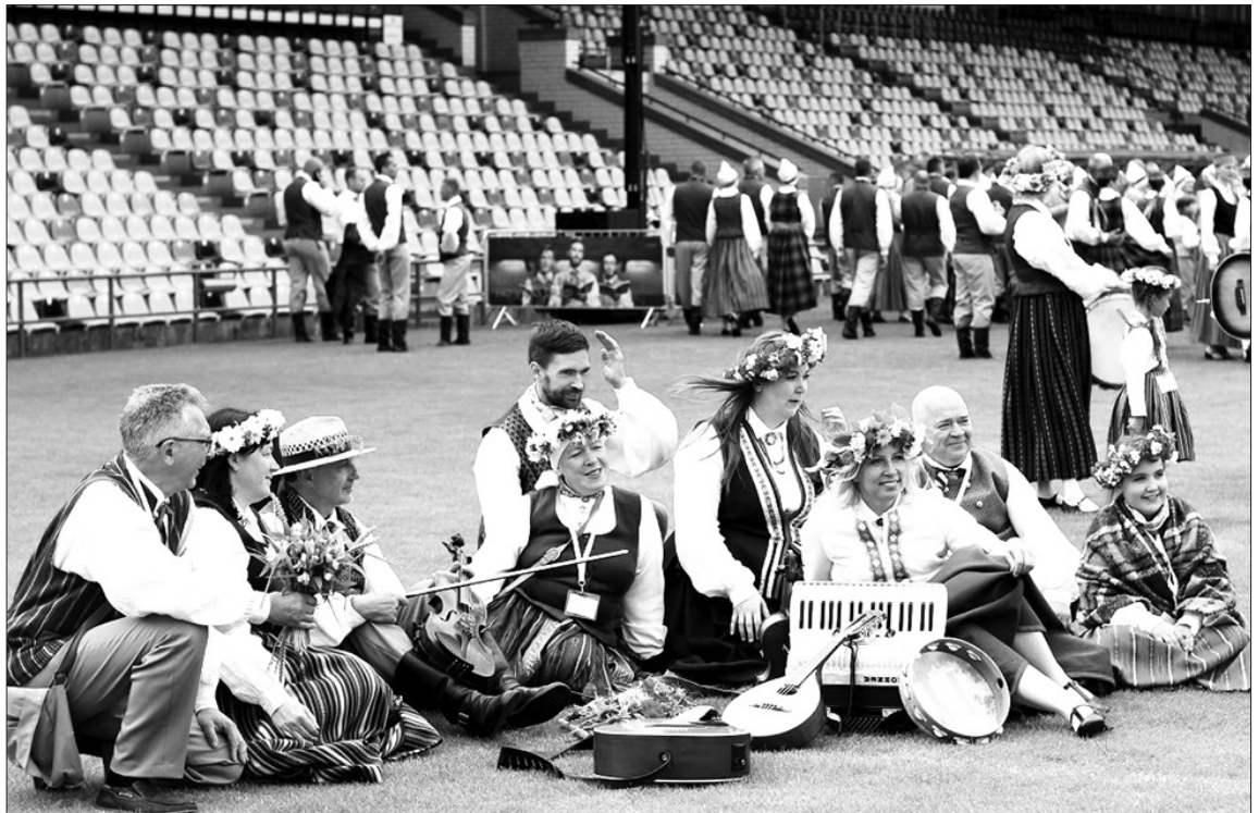
Folkloras kapela “Karikste” atpūtas brīdī pēc Svētku gājiena.