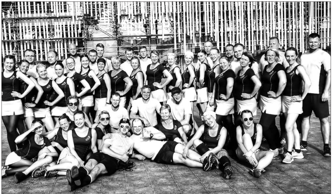
Abi deju kolektīva “Pēda” sastāvi – jauniešu grupa un vidējās paaudzes grupa satikušies kopbildē Daugavas stadionā.