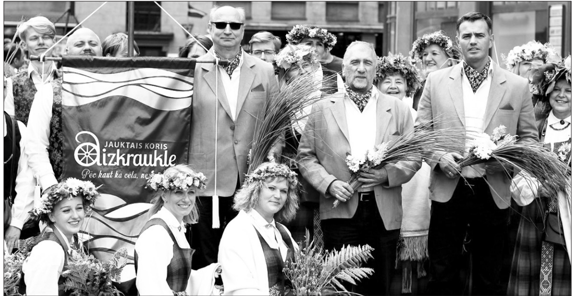
Jauktā kora “Aizkraukle” dalībnieki kopā ar pašvaldības vadību.