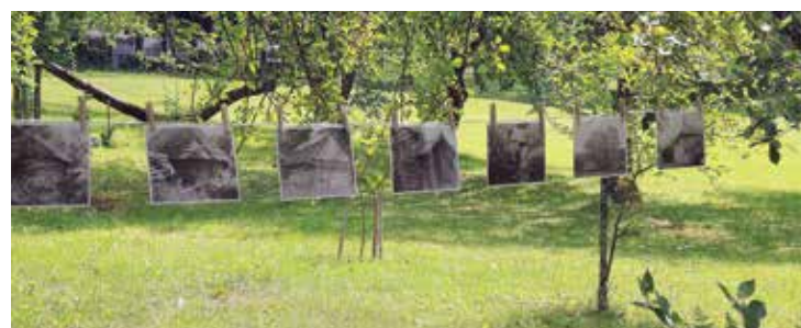
Visas dienas garumā bija skatāma fotoizstāde "No 1968. līdz 1993.".

Bārdu dzimtas memoriālā muzeja "Rumbiņi" vadītāja