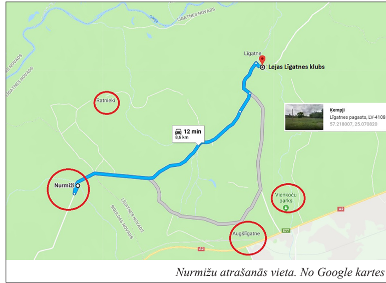
Nurmižu atrašanās vieta. No Google kartes

Līgates-Kempu pārtikas biedrība atkal rosīgi turpina savu darbību, par spīti visiem nelabvēļiem un skauģiem, kuri pravietoja viņai drīzu jo drīzu pilnīgu iziršanu, pēc tam kad šāgada sākumā bija izcēlusies dažu iemeslu dēļ šķelšanās, kas sadalīja biedrus divās naidīgās partijās. Tas tagad pārvarēts, un biedrība labām cerībām var raudzīties nākotnē. Kad visi cieši kopā turas, tad biedrībai nekas nevarēs kaitēt, tikai pašu biedru nevienprātība viņu var gāzt. Biedrībā šim brīžam ir dižs skaits biedru, tas sniedz pāri par simtu. Konkurences saprotams tai arī netrūkst, jo pārējās pārdotavas visādi zin pielabināt pircējus.