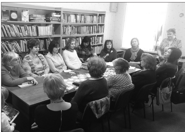
Vecmāmiņas tiekas Līgatnes bibliotēkā.