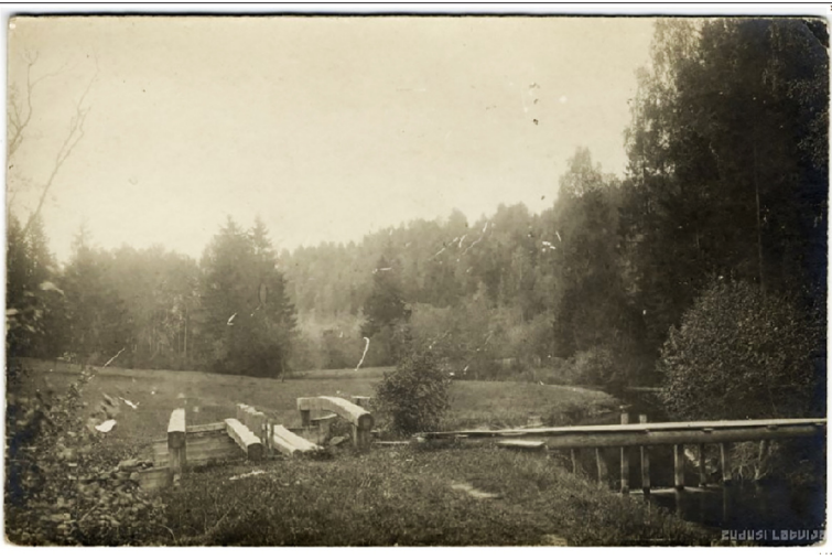
Līgatnes ainava 1920. gadā pie augšējām slūžām Ķempju gravā, kur no Līgatnes upes atdalījās kanāls uz Anfabriku. (Tas ir vairāk kā 1 km uz augšu no Anfabrikas, gandrīz pretī Zanderu kapiem).