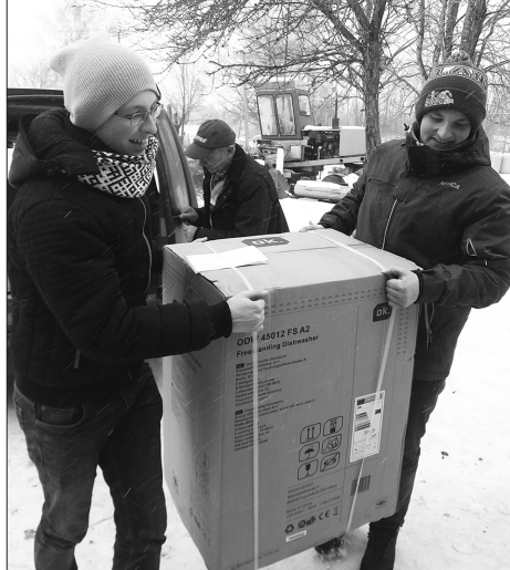
9. klases skolēni piegādā iegādātās dāvanas.

Kārtējo reizi tika pierādīts, ka kopā mēs varam daudz!