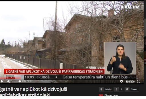
Līgatnē var aplūkot kā dzīvojuši papīrfabrikas strādnieki. LTV1 raidījums par ekspozīciju "Līgatnes strādnieka dzīvoklis".

1886. gada 10. decembrī laikraksts Balss rakstīja: