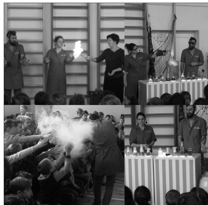
Zinātkāres vakars Līgatnes novada vidusskolā.

Skolēni iepazīs ar profesijām un prasmēm, bez kurām nebūtu iespējams izveidot transportlīdzekli - pie tā tapšanas strādā programmētāji un mākslinieki, inženieri un elektronīki, arhitekti.