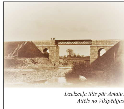
Dzelzceļa tilts pār Amatu. Attēls no Vikipēdijas

pie draudzes tiesas. Rudenī lieta izrādījās jau drusku šaubīgāka. Nedēļām viņam gadījās ceļi. Vienmēr viņš gaidīja tūkstošus, pavēstīja tad un tad tos, kam nākas, bet aiz vienu ne pats, ne tūkstoši neieradās. Pēdīgi M. atlaida strādniekus un uzraugus, viņa kompanjoni izklīda. Pašā rudenī, kad darbi patlaban visur aplkusa, ieradās jauni spēki – daži jauni cilvēki iz Rīgas. M. viņus pieņēmis par kasieriem un rēķindevējiem. Algas brangas, pa 60 rbļ. mēnesī. Darīšana būšot ar naudu; tādēļ vajadzējis ielikt 500-600 rbļ. zaloga 10 . Darba viņiem gandrīz nekāda nebija. Tādēļ drīzi vien viņi izklīda; kas ar viņu algām un zalogiem palika, to zinās vislabāk viņi paši!