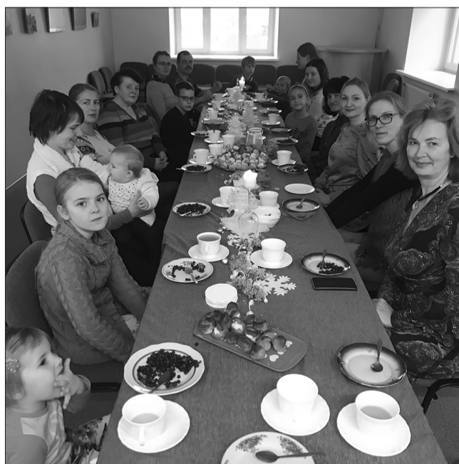
Tiekas Līgatnes Māmiņu klubs