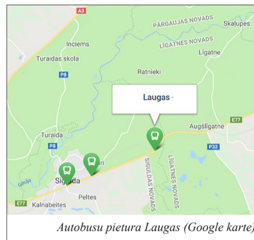
Autobusu pietura Laugas (Google karte)

nu uzzini! Labajā ceļa laikā pieveda diezgan maz būvmateriāla. Peļņa līdz šim ļoti maz. Pa ziemu dzina vietvietām svajas (mietus) 5 un šur tur strādā vēl tagad ar viņiem. Pēc Lieldienām sāksoties dzīva kustēšanās. Runā – no tūkstošiem strādnieku. Redzēsīm, pagājušu vasaru dzirdēja arī tādas valodas.