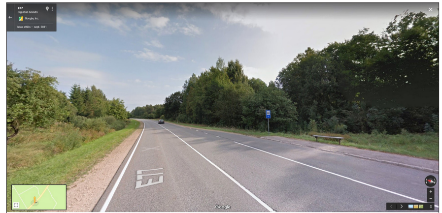
Autobusu pietura Laugas. Te – starp šoseju un dzelzceļu – atradās tas ciemats, kur žandarms meklēja iespējamus sliežu postītājus