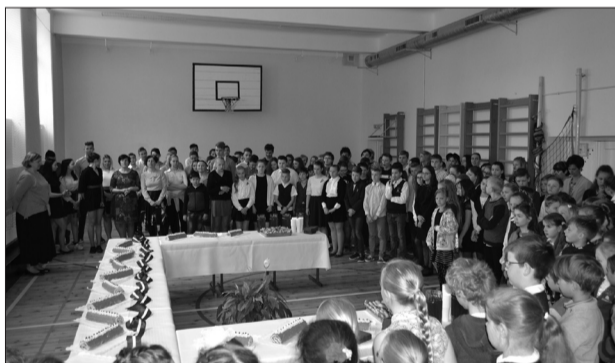
Baltā galdauta svētki Līgatnes novada vidusskolā.

Pēc mācību stundām visi atkal sanāca kopā, lai svinētu Latvijas brīvību un neatkarību ar kopīgu Latvijas valsts