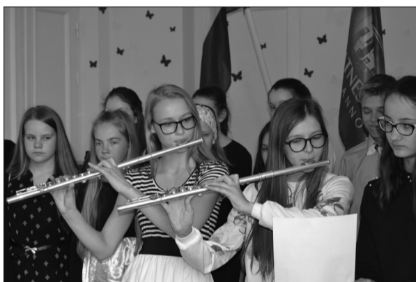
Konkurss "Dziesma manai Latvijai" Līgatnes novada vidusskolā.

Jau krietnu laiku pirms pasākuma skolēni gan ar mūzikas skolotāju un klašu audzinātāju atbalstu, gan paši saviem spēkiem gatavoja priekšnesumu šai dienai - dziesmu. Daudzi bija izvēlējušies dziedāt