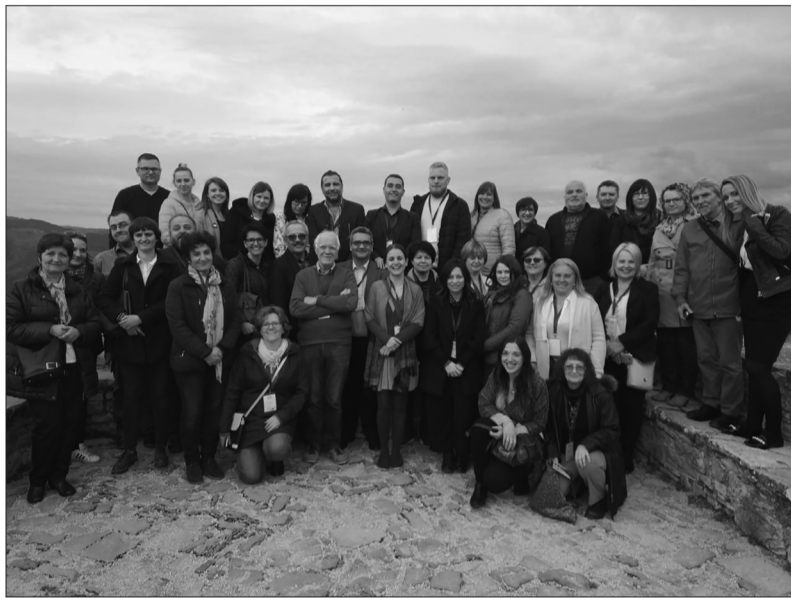
ENSURE projekta sanāksmes dalībnieki Horvātijā.

Sekojet mums ENSURE Facebook lapā, lai iepazītos ar pasākumu un projekta aktivitāšu informāciju: https://www.facebook.com/ensurenetwork/