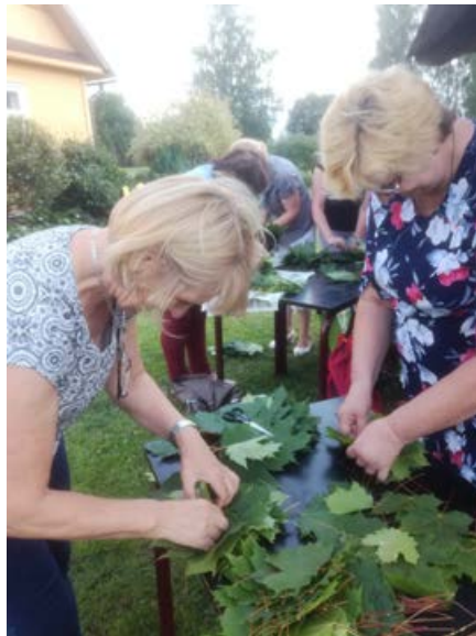
Strādājam ar kļavu lapām.

Gida pavadībā ielūkojamies vēstures un lietišķās mākslas muzeja ekspozīcijā. Sajūsmināja atklātā muzeja mācību krātuve „Mārga”, kura iekārtota vārtsargu namiņā, varēja iepazīt 19. gs. pūra lādes saturu. Borhu muižas kapela sagaidīja ar savu mieru un klusumu. Varējām arī aplūkot zem kapelas ierīkoto iespaidīgo kapliču.