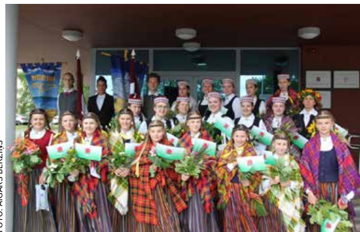
Kultūrizglītības centra kokaletāju ansamblis „Balti” un Mūzikas skolas kokaletāju ansamblis „Dzītariņi”.