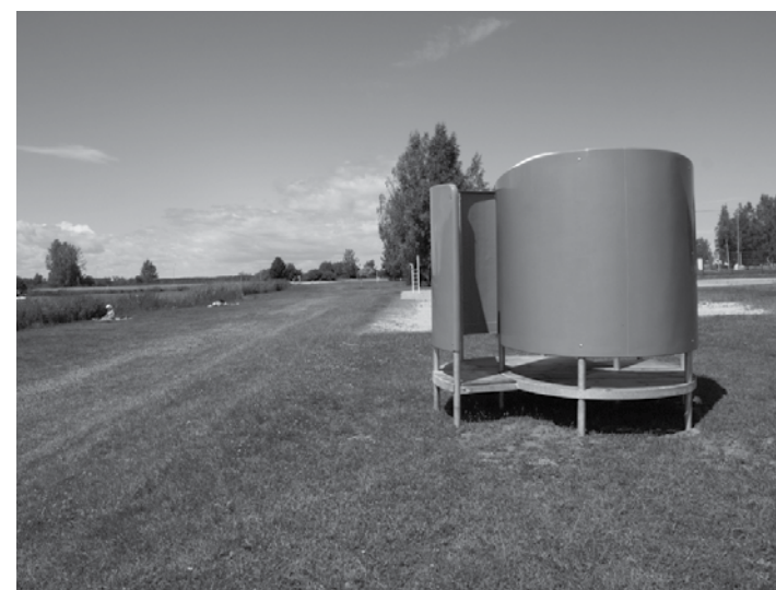
Uzstādītas divas pārgērbšanās kabīnes pludmalē pie Piņķu ūdenskrātuves.

novēšanai, lai nodrošinātu visu nojumju drošu ekspluatāciju.