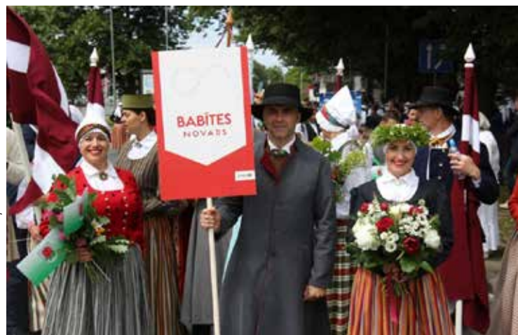
Babītes novada pašvaldības radošie kolektīvi Svētku gājienā.

FOTO NO SVĒTKU ATKLĀŠANAS PASĀKUMA VĀRTIEM PIE SKONTO STADIONA