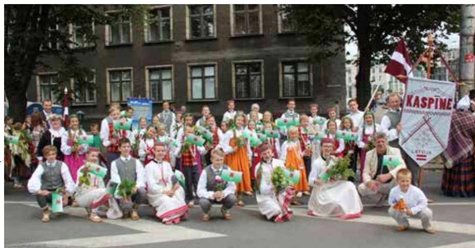
Kultūrizglītības centra bērnu un jauniešu tautas deju kolektīvs „Kaspīne”.