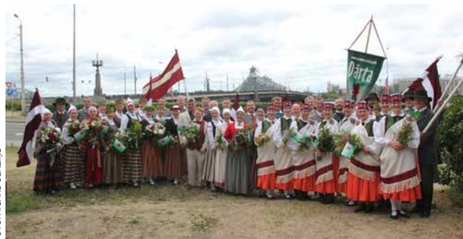
Babītes novada pašvaldības radošie kolektīvi.