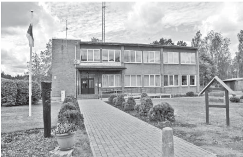
Kūku bibliotēka tagad.