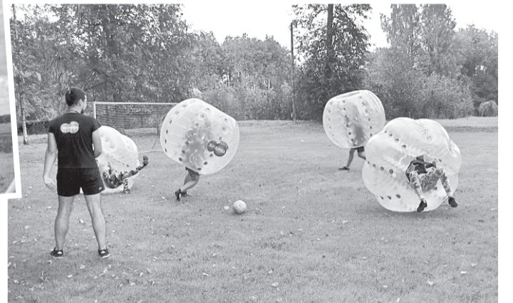
Burbuļfutbolā visprasmīgākie izrādījās Neretas novada jaunieši