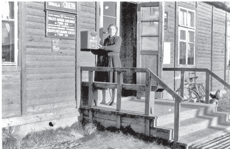
Ēka, kurā atradās ciema padome, pasts un bibliotēka (1954.gads).

Klāt jau septembris – aizvadīta vasara, skolās mācību gada sākums, bet šoreiz ne tikai – šogad 1. septembris, ir laiks, kad Kūku bibliotēka svin nozīmīgu jubileju – 70 darba gadus.