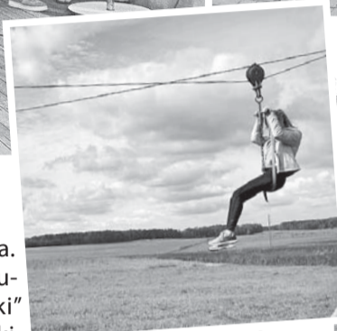
Lauku sētā "Vidzemnieki" jauniešiem varēja ne tikai apskatīt lauku sētas iemītniekus, vienoties kopīgās latviešu tradicionālajās spēlēs un rotaļās, bet arī sajūst ātrumu un adrenalīnu nobraucot pa virvju trosi