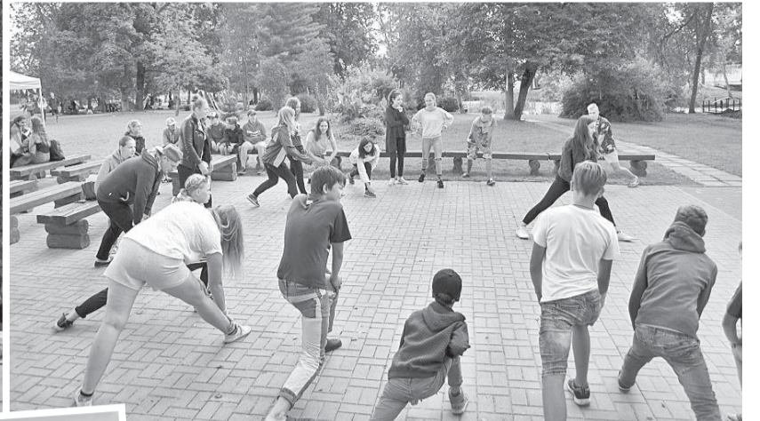
Uzmundrinošajā rīta rosmē jaunieši sevi uzlādēja ar pozitīvu enerģiju visai dienai