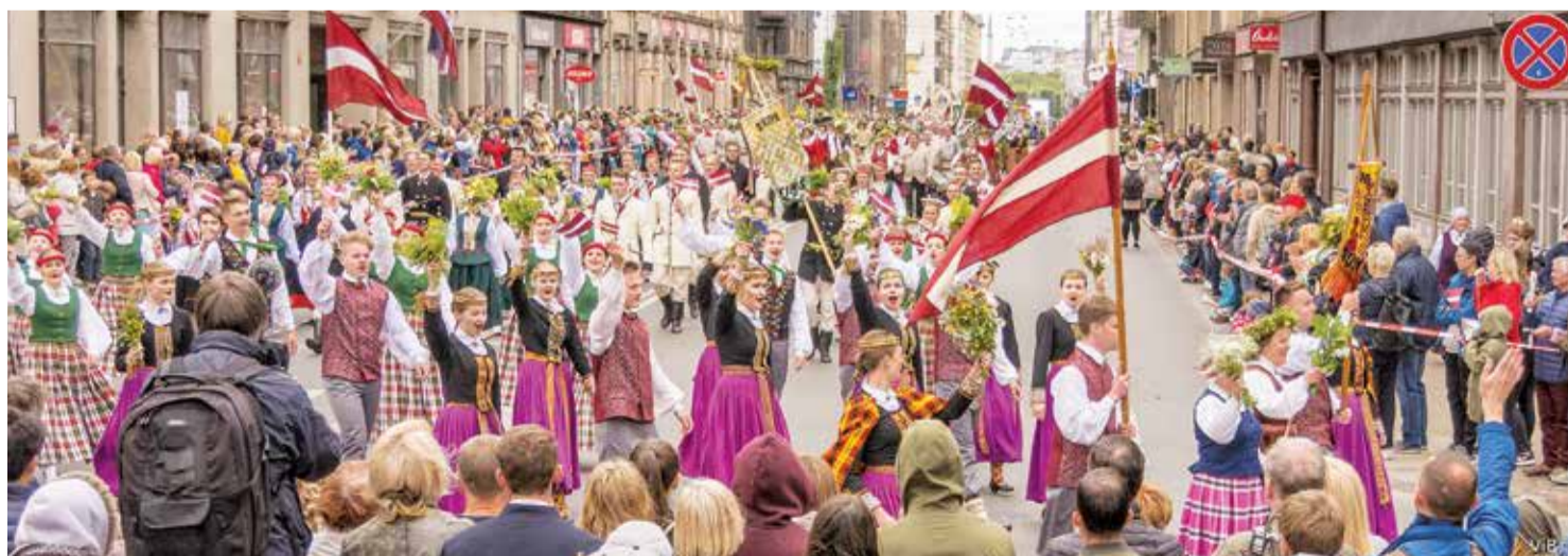
Simtgades svētkos Salaspils novadu pārstāv 12 mākslinieciskās pašdarbības kolektīvi.

No Salaspils novada dalībai svētkos ir izvirzīti 12 mākslinieciskie kolektīvi: JDK “Ūsiņš”, JDK “Austriņš”, SDK “Rīgava”, VPDK “Ūsa”, jauktais koris “Elpa”, jauktais koris “Lōja”, jauniešu VA “Sunrise”, PO “Salaspils”, Salaspils Mūzikas un mākslas skolas koka ansambļa, Salaspils amatierteātris, krievu dziesmu ansamblis “Otrada” un deju ansamblis “Karuselis”. Par godu svētkiem no 6. līdz 8. jūlijam Rīgavas mūzikas un mākslas dārzā notiks dažādi pasākumi. 6. jūlijā plkst. 20.00 uzstāsies Salaspils sadraudzības pilsetas – Finstervaldes dāmu koris un četri dziedoņi, vakara turpināju-