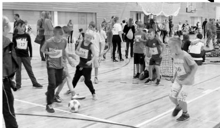
Pērn mūsu sporta biedrības aktīvi iesaistījās bērnu sporta svētku "Karlsone" organizēšanā.

Atbalstu 2017. gadā no pašvaldības ir saņēmušas šādas biedrības: