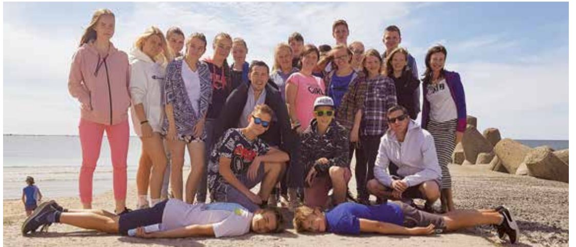
Talantīgākie jaunieši šogad aizvadīja izglītojošu nometni Kazdangā.

Izbraukuma dienā devāmies uz pilsētu, kur piedzimst vējš – Liepāju. Zinātkārie jaunieši vispirms