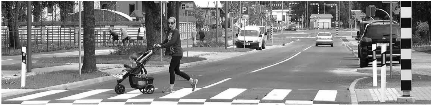
Lauku ielā atradīsies arī jaunais bērnu dārzs.

Turpinās arī daudzdzīvokļu namu pagalmu labiekārtošana. Tā būvdarbi ir pabeigti Gaismas ielas 22. un 24. nama teritorijās. Savukārt izstrādes stadijā šobrīd ir Skolas