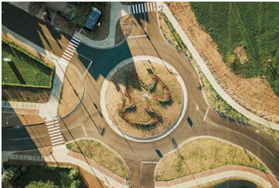
Skats uz jauno Lauku ielas apli no putna lidojuma.