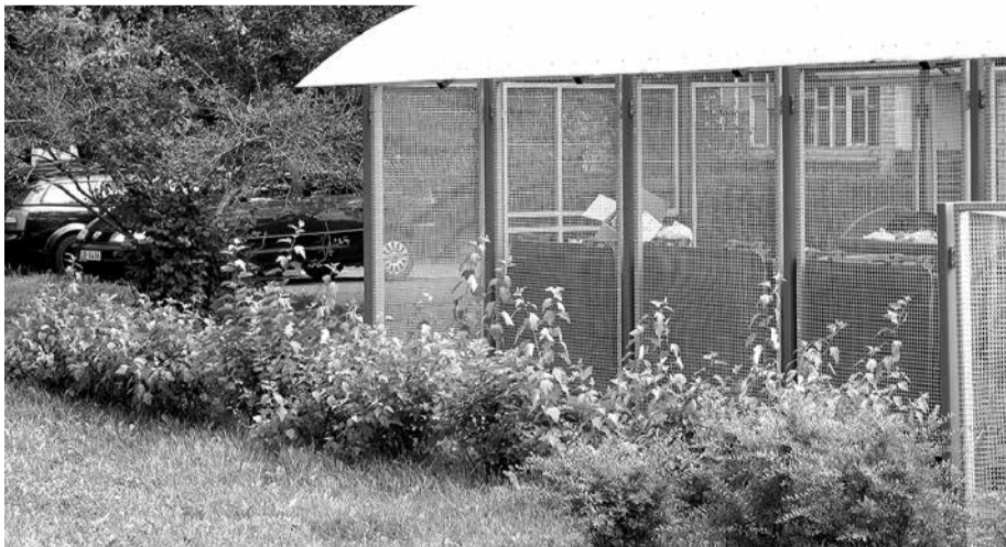
Atkritumu laukumi Saulkalnē – agrāk un tagad.