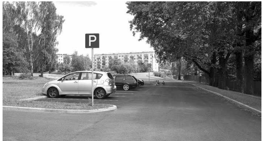
Neglīto metāla garāžu vietā tagad skatīenam paveras ainaviska iela ar ērtām autostāvvietām.